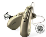
Phonak Audéo™ Marvel Un coup de foudre auditif