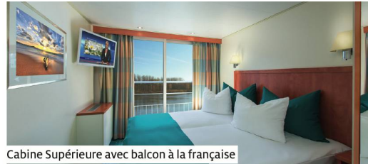
Cabine Supérieure avec balcon à la française