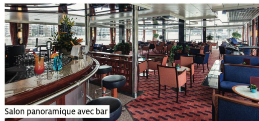
Salon panoramique avec bar