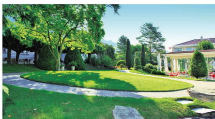
Les 3 bâtiments de l'établissement sont idéalement implantés au cœur d'un parc arborisé de 10'000 m 2 .