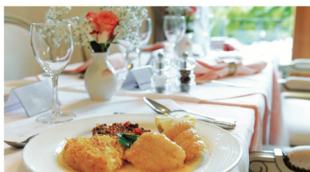
Une table et un service hôtelier de premier ordre.