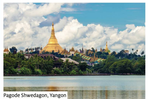
Pagode Shwedagon, Yangon

Toutes les excursions incluses | Sous réserve de modifications du programme