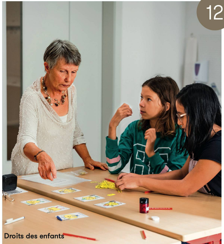
Droits des enfants