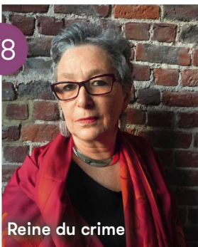
Reine du crime