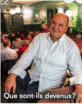
Que sont-ils devenus?