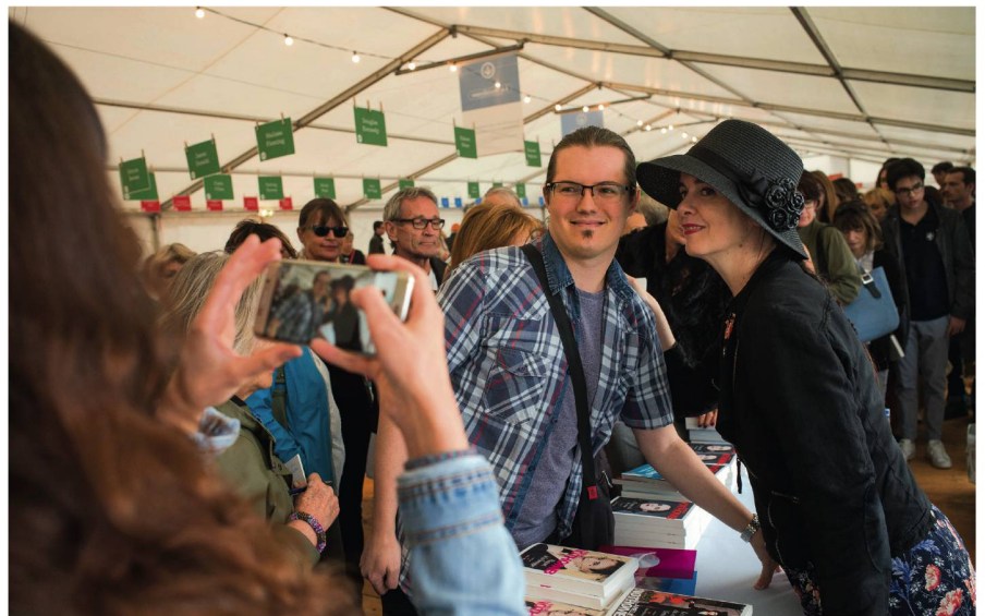
Amélie Nothomb adore rencontrer ses lecteurs. Comme ici, en 2017, à Livre sur les quais. Elle sera de nouveau à Morges cette année en tant que coprésidente de la manifestation.

Gagnez des places pour une rencontre et une séance de dédicaces avec Amélie Nothomb en page 88.