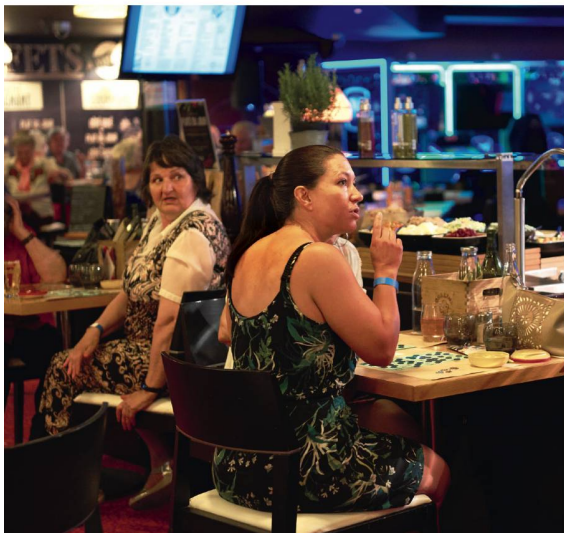
fois par mois. De quoi ravir la direction