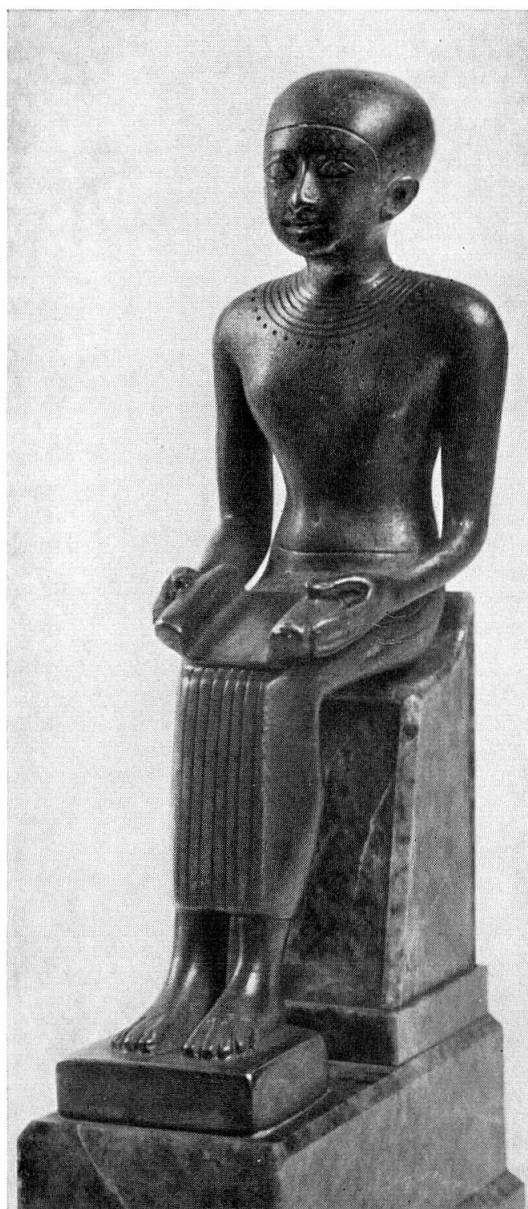
Fig. 2. Im'hotep

Statuette d'argent, environ 800 av. J.-C. «Wellcome» Histor. Med. Museum, No. R 35 / 1936