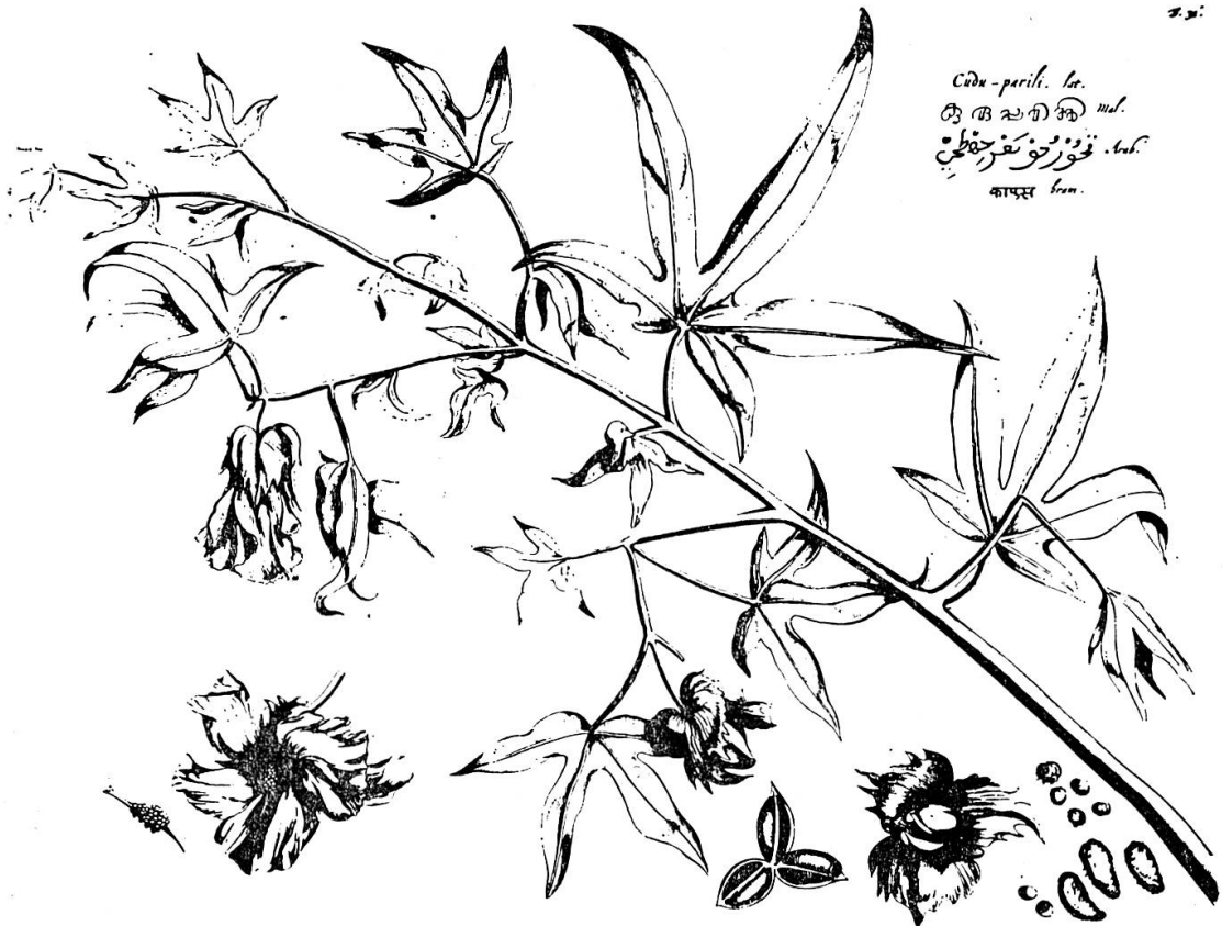
Abb. 2a. Eine Pflanze, Appél, aus Hortus Indicus Malabaricus , Band 1, 1678, S. 53

Cadu-pariti. lat. കാടുപരിതി mal. قورخو نقره - lat. कापूस bra.