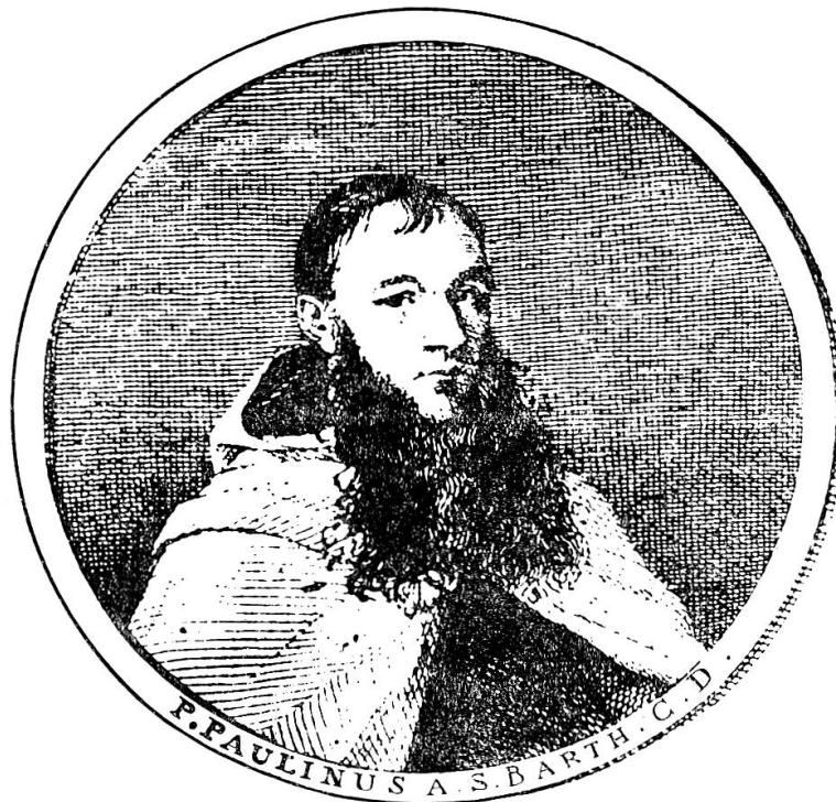
Abb. 4. JOHANN PHILIPP WESDIN, der als Karmeliterpater den Namen PAULINUS A SANCTO BARTHOLOMAEO trug. Er brachte 1790 die erste Sanskrit-Grammatik zu Druck, übersetzte einige medizinische Schlokas und wies auf die riesige Zahl medizinischer Manuskripte in Indien hin (aus Fr. PAOLINO DA S. BARTOLOMEO, Viaggio alle Indie Orientali , Roma 1796)

Zu dieser Zeit haben sich nicht nur die Engländer mit indischen, besonders mit Sanskrit-Texten beschäftigt. Wie wir schon hörten, hat damals auch die katholische Mission an der Bewältigung des Sanskrits gearbeitet. JOHANN PHILIPP WESDIN, der 15 Jahre in Indien weilte, wurde bereits als Schöpfer der ersten Sanskrit-Grammatik genannt (Abb. 4). Er wandte lange Jahre seine Aufmerksamkeit den Sanskrit-Texten zu, sammelte sie in Malabar und studierte auch noch nach seiner Rückkehr aus Indien die indischen