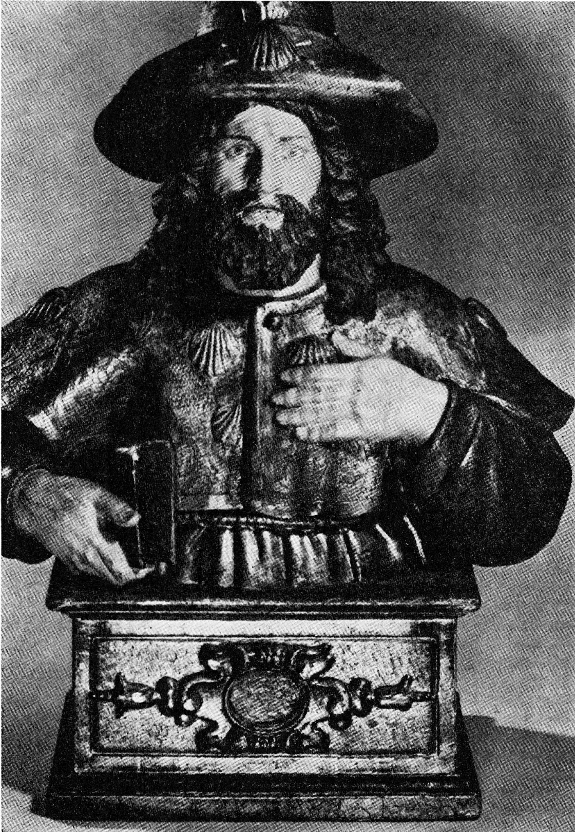
Fig. 5. Buste reliquaire de Saint-Jacques-de-Compostelle en bois doré, sur socle, Eglise de Cazères-sur-Garonne (H.-G.), reproduit d'après Pl. XII, Pèlerins et Pèlerinages dans les Pyrénées Françaises , Musée Pyrénéen, 1975