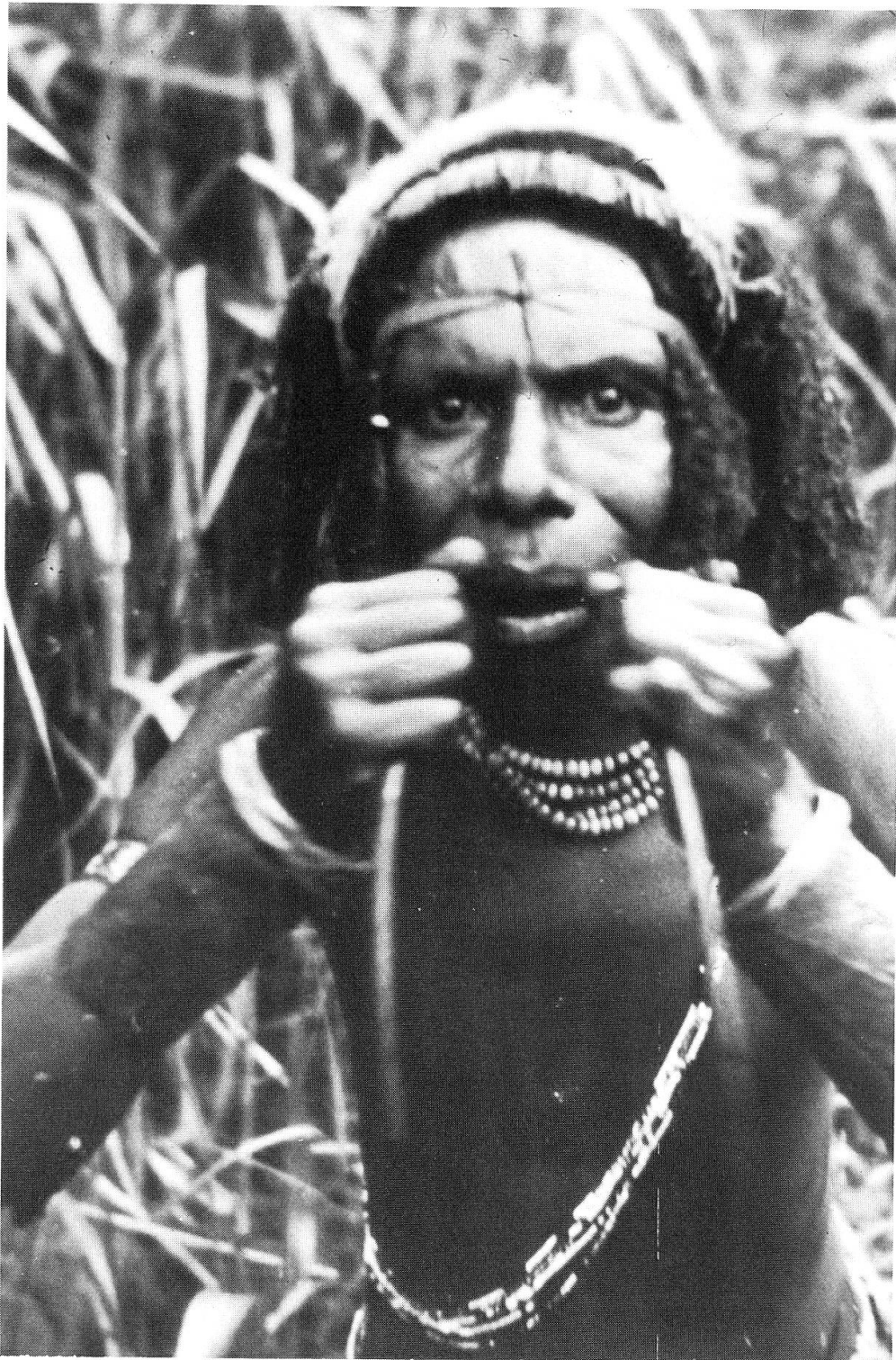
Abb.4. Nach Applikation der Magenrute wird durch rhythmische Bewegungen Brechreiz erzeugt (Bena-Bena).