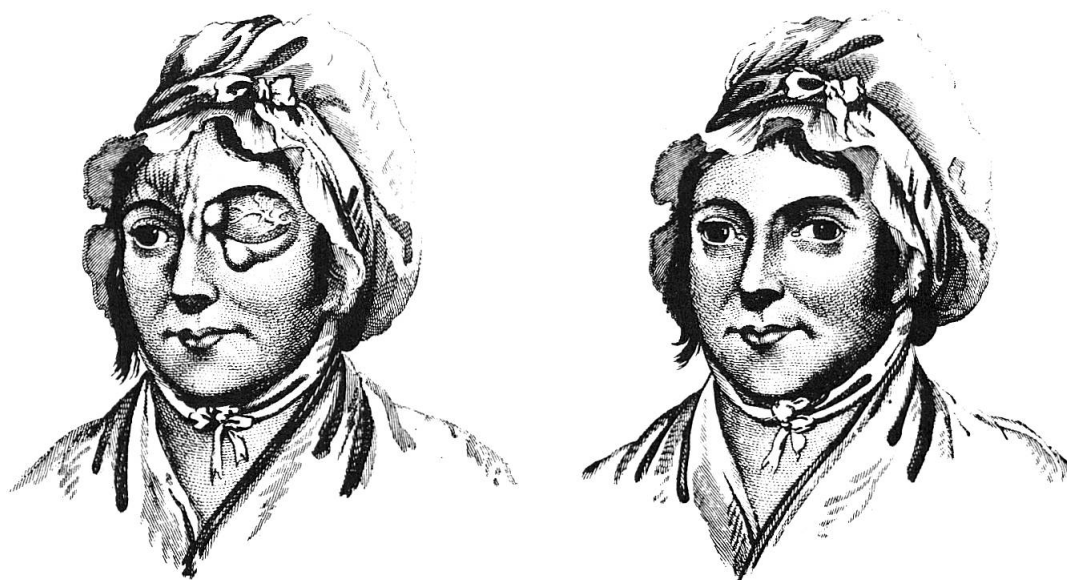
Figg. 3 e 4 – La paziente di Benjamin Travers (donna di 34 anni) prima e dopo la legatura dell'arteria carotide comune sinistra. Le lesioni endorbitarie a sinistra si sovrappongono sostanzialmente, mutatis mutandis, a quelle del Feldmaresciallo Radetzky

comune» di Benjamin Travers (1783–1858) 8 . L'esauriente descrizione di Travers (donna di 34 anni) è accompagnata da perspicua iconografia, che viene qui riprodotta (Figg. 3 e 4) grazie alla affinità con taluni punti sostanziali della descrizione di Hartung. Nel suo complesso, essa può infatti servire a darci un'idea «mutatis mutandis» del «tumore» endorbitario di Radetzky. Le lesioni del caso Travers (vistose varici, più o meno nodulari, chemosi, tumefazione dei tessuti endorbitari e conseguente esoftalmo, etc.) (Fig. 3) sono tutte conseguenza del forte aumento di pressione trasmesso al sangue venoso dalla patologica comunicazione di questo col sangue arterioso. Ne è prova perspicua la scomparsa della sintomatologia in seguito alla legatura dell'arteria carotide comune al collo.