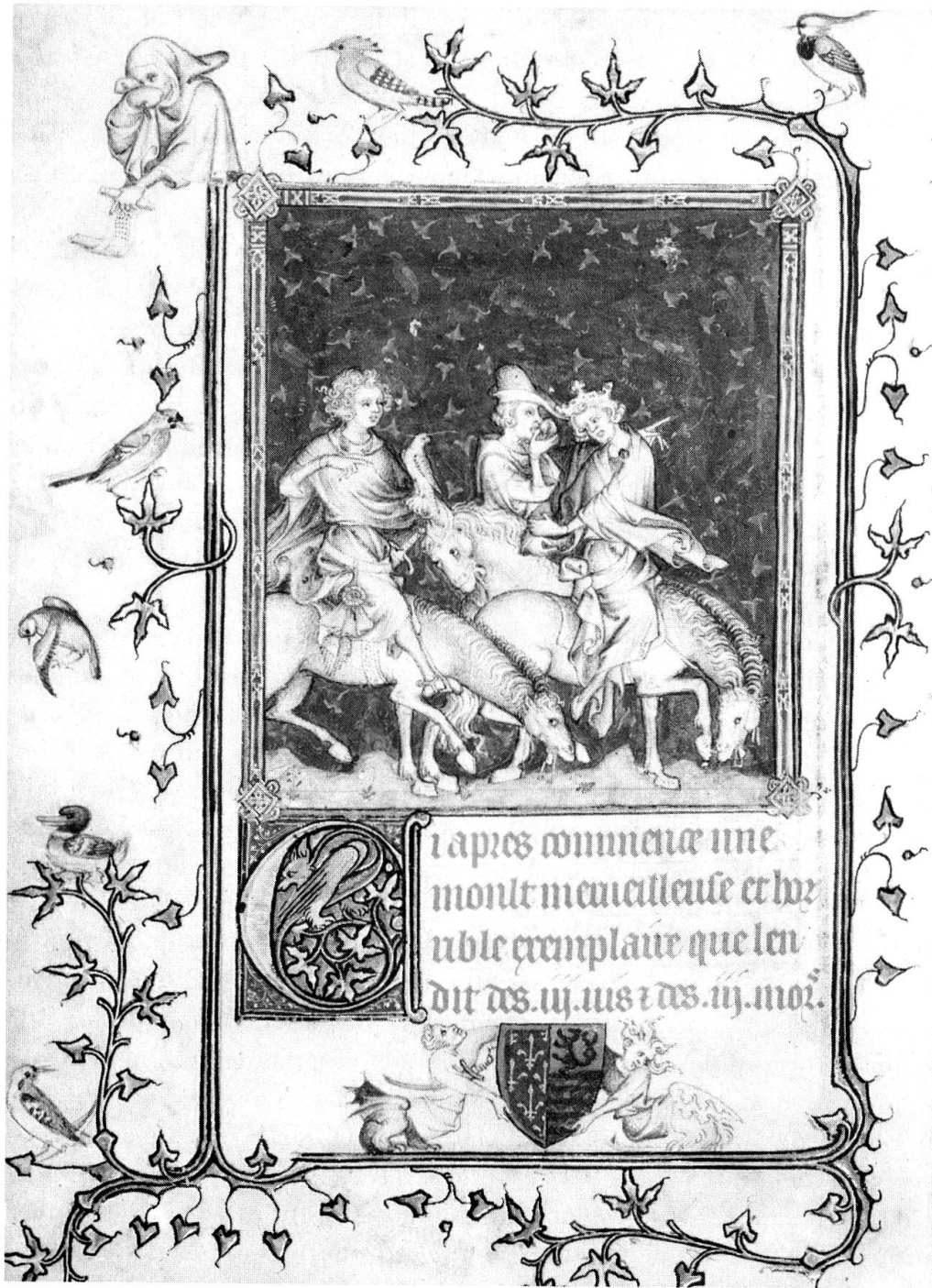
Abb.2 und 3: Psalter der Bonne de Luxembourg, Fol.321 r und 322 r : Die Begegnung der drei Lebenden und der drei Toten. Nachweis: The Metropolitan Museum of Art, New York, The Cloisters Collection 1969. (69.86)