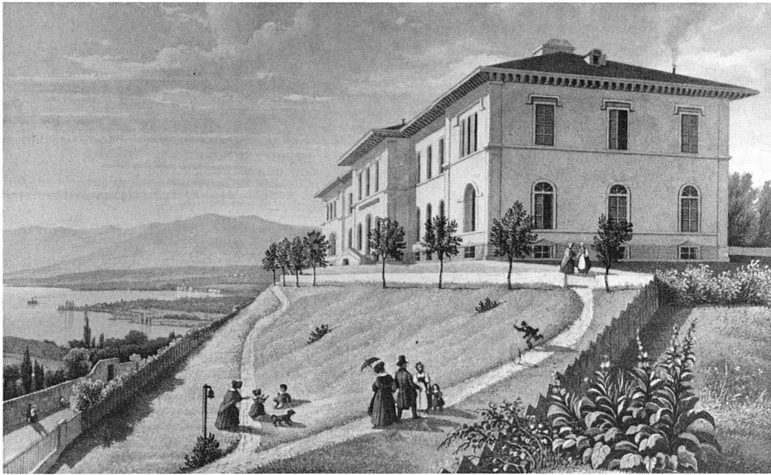
L'Asile des aveugles de Lausanne (1843), vers 1845 (Gravure de Frédéric Martens, Musée historique de Lausanne).

cantonal dès 1806, assuré d'une dotation considérable grâce à la suppression de l'Hôpital de Villeneuve, l'établissement entame sa lente mue de «miséricorde» en hôpital moderne, avec le départ successif des aliénés (1811) 10 , des détenus (1826) et des établissements de redressement pour garçons (1847) et filles (1869) 11 . La transformation de l'asile en centre de soins s'étend donc sur quatre-vingts ans, du rapport Tissot à l'ultime épuration. Mue trouvant son expression décisive dans le dernier quart du siècle, avec deux premières réalisations publiques d'envergure: l'Asile d'aliénés de Cery (1873) 12 et l'Hôpital cantonal du Calvaire (1883). L'Etat de Vaud, jusque-là trop absorbé par les charges multiples de l'indépendance et les soubresauts politiques de 1830, 1845, 1861, est enfin en mesure d'assumer son rôle en matière d'établissements pour malades. De plus, l'hôpital général, après six siècles au cœur de la cité, domine désormais symboliquement la ville, du haut de la pente du Champ-de-l'Air.