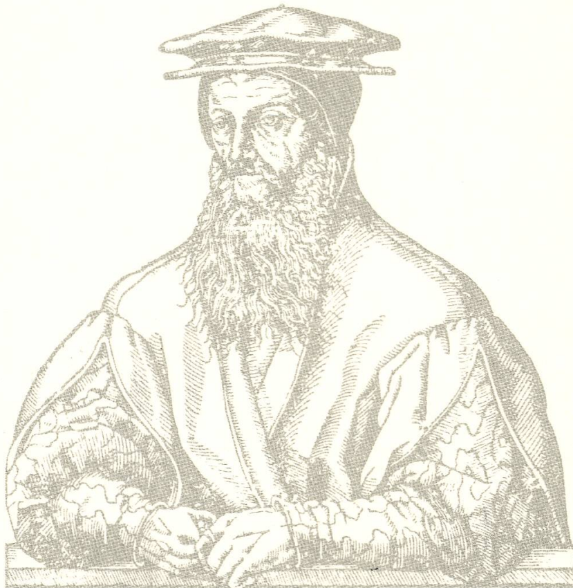
Conrad Gessner 1516–1565

Swiss Journal of the History of Medicine and Sciences Vol. 56 (1999) N° 3/4