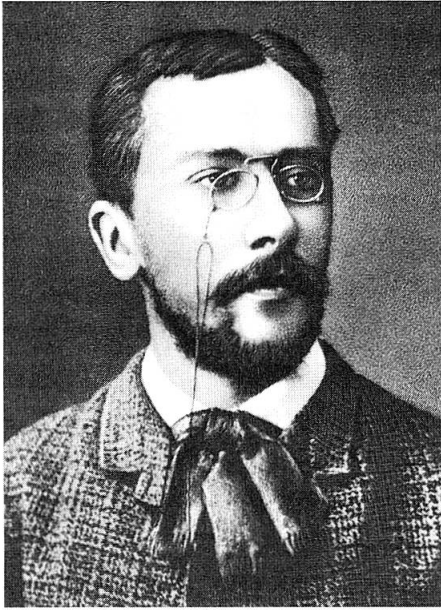
Abb. 1. Konstantin Sergeevič Merežkovskij (1855–1921). Aus: Höxtermann 1998, 11.

Im Jahr 1878 fand in Kassel die 51. Versammlung der deutschen Naturforscher und Ärzte statt, auf der der Strassburger Botaniker Anton de Bary (1831–1888) den Begriff Symbiose als eine «Erscheinung des Zusammenlebens ungleichnamiger Organismen» prägte 1 . 30 Jahre später übertrug der russische Zoologe und Botaniker Konstantin Sergeevič Merežkovskij das Symbiosekonzept von der Entwicklungsgeschichte auf die Stammesgeschichte und begründete mit seiner Theorie der Symbiogenesis eine neue Lehre von der Entstehung der Organismen 2 . Es sollten weitere 60 Jahre vergehen, bis im Ergebnis molekulargenetischer Befunde die amerikanische Zellbiologin Lynn Margulis (geb. 1938) die Symbiogenesetheorie neu