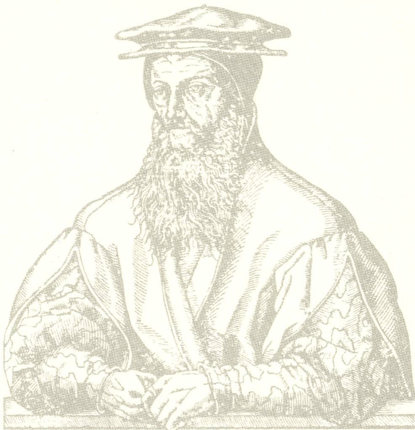
Conrad Gessner 1516–1565

Swiss Journal of the History of Medicine and Sciences Vol. 59 (2002) N° 3/4