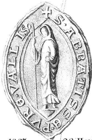
1337, 22 Herbstm.