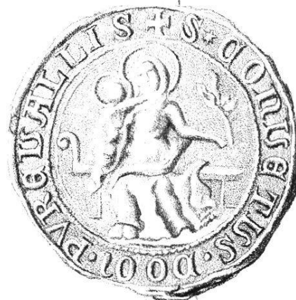
1343, 15 März.