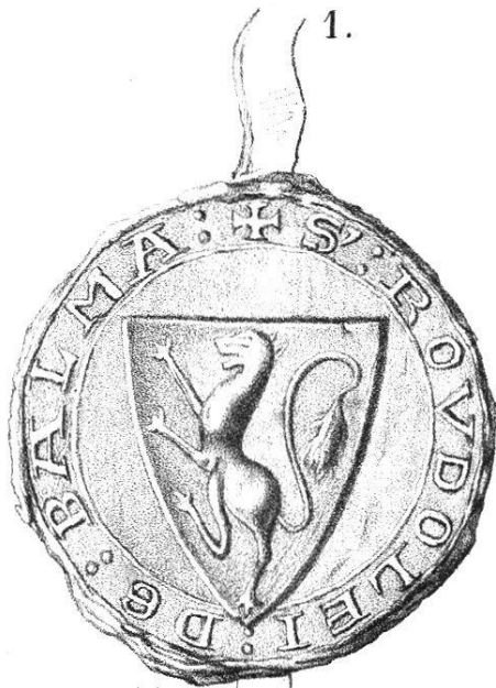
1. 1275, 23 Heum.