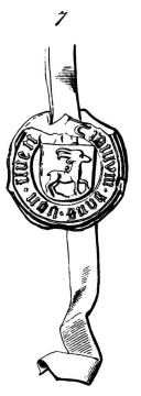
1468, 21 Brachm.