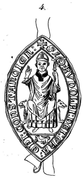
1252, 18 Wismar.

4 1 7 Cum omnibus adiacentibus velus p[ro]prietariis sicut in chartis fir[m]i fundacionibus. Id est p[ro]p[ri]etate domus cum delectis domibus. Et ceteris que ad illam desuper positas manibus utrasque que p[ro]p[ri]etate de sacris ecclesiis et in laicis. sicut p[ro]p[ri]etate p[ro]p[ri]etate. equis equitibus de ceteris adiacentibus p[ro]p[ri]etate sacris de ceteris quibusdam. tenentur cum universis ceteris. de ceteris p[ro]p[ri]etate