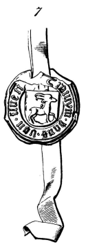
1468, 21 Bremen.