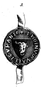
1258, 20 Mail.