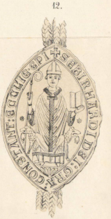
1257, 2 Brachm.