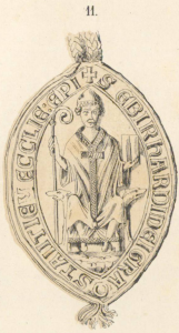
1251, 14 März.