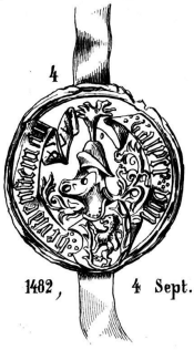
1482, 4 Sept.