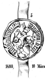
1480, 10 März.