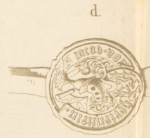
1502, II. Winterm.