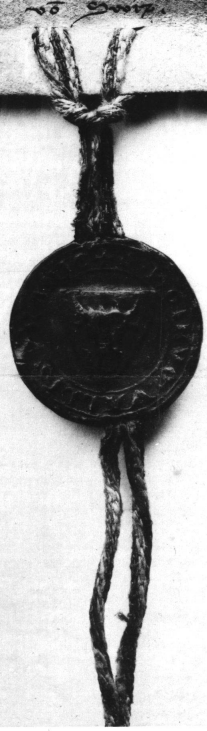
Lichtdruck von Gebr. Carl & Nicolaus Benziger in Einsiedeln.