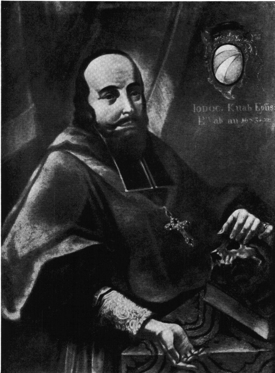
BISCHOF JOST KNAB