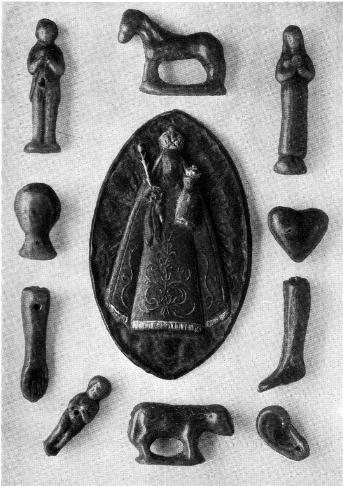
Votivfigürchen aus Wachs