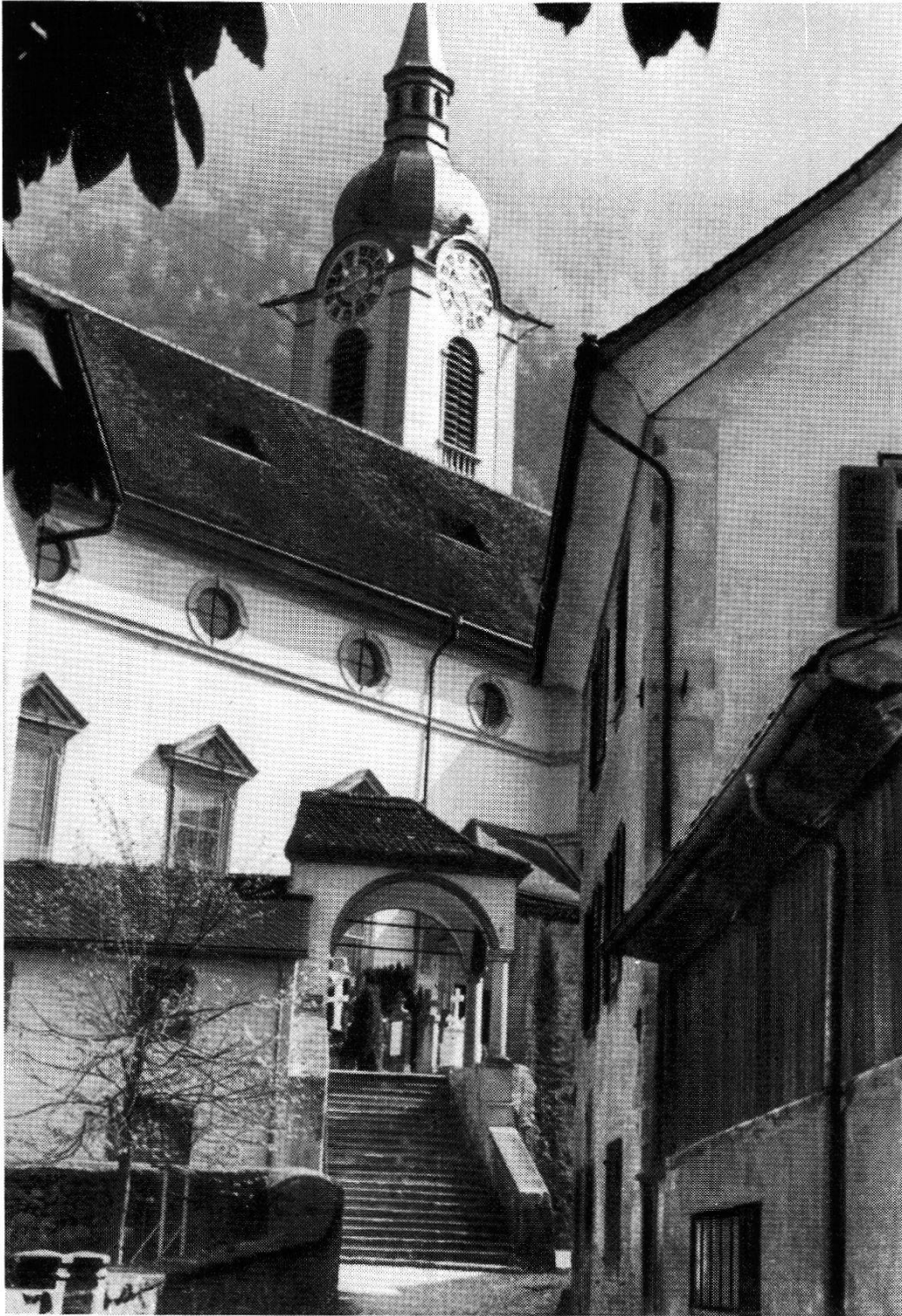
Aufstieg zur Kirche beim Fremdenspital in Altdorf. Rechts die Kaplanei der Herren von Beroldingen.