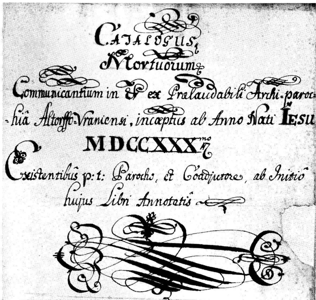
Titelblatt des Sterbebuches von 1730—1795. (Siehe S. 280).