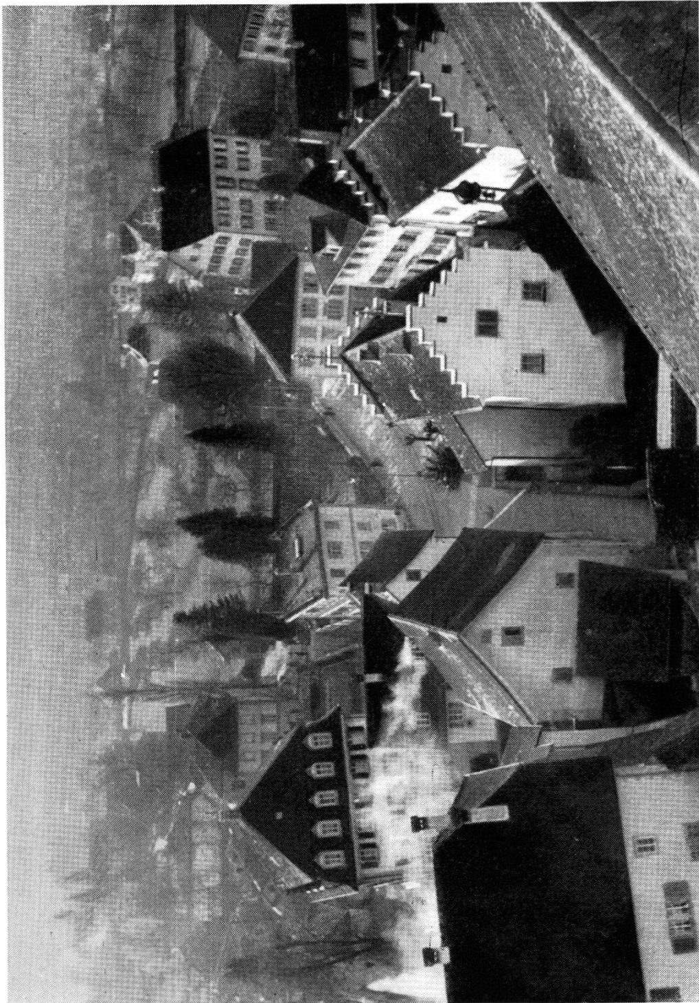
Der Fremdenspital, links davon die Kaplanei von Beroldingen.

Nr. 6356 BRB 3. 10. 39.