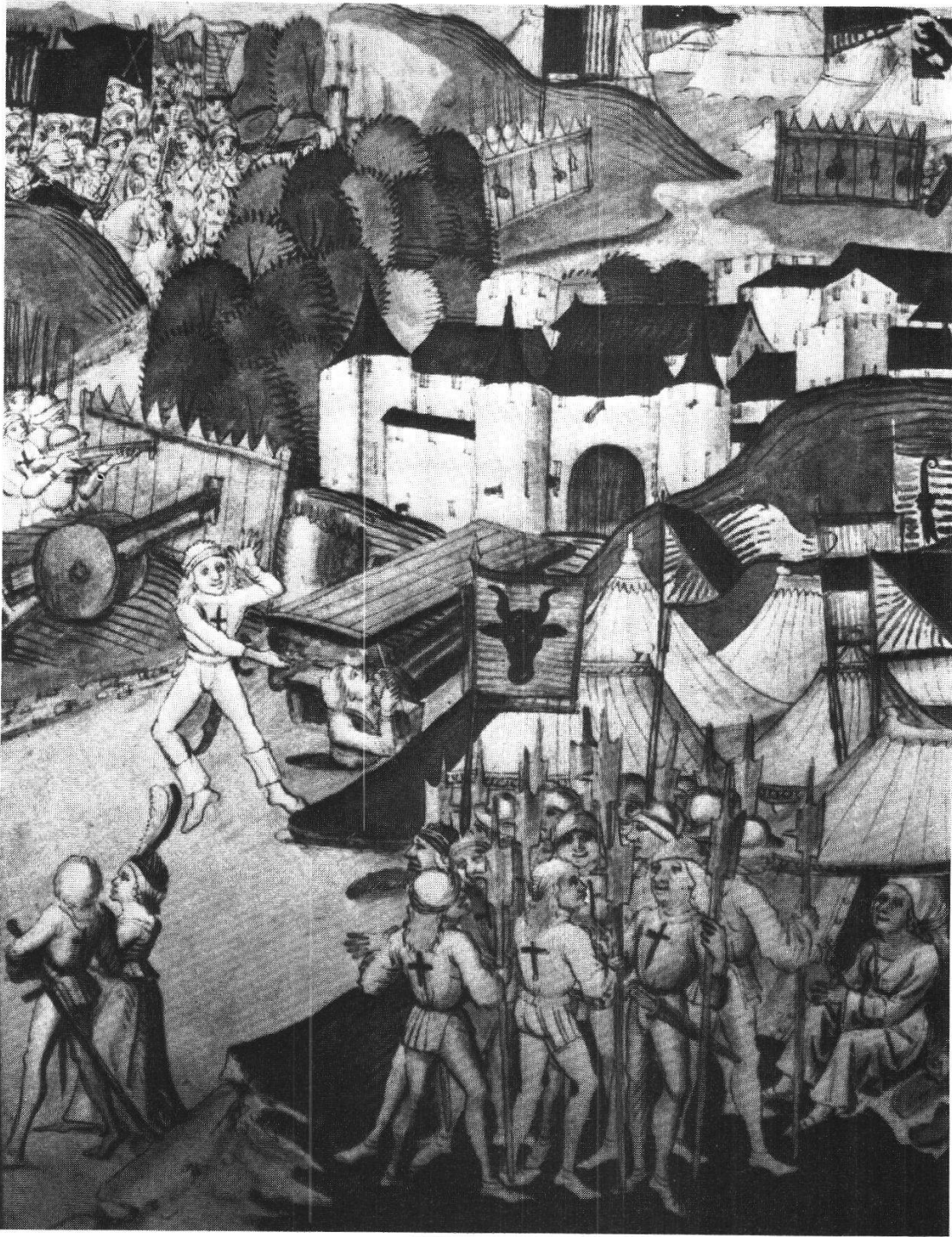
Abb. 11 Marketenderinnen im Lager der Eidgenossen vor Héricourt (Berner Schilling, Bd. 3, S. 282)