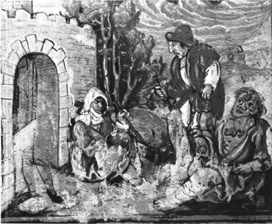
Abb. 10 Vor einem Stadttor lagernde Seuchekranke (Luzerner Schilling, fol. 21v-Ausschnitt)

Frauen und Kinder mehr als Opfer einer gewaltätigen Männerwelt, so wenn sie in Weggis ohnmächtig zusehen müssen, wie die Luzerner ihre widerspenstigen Ehemänner und Väter kurzerhand auf Nauen entführen. Dann treten Huren, Pfaffendirnen, Kinds- und Männermörderinnen auf den Plan, vor allem aber Marketenderinnen. Für Letztere hat der Berner eine besondere Vorliebe und zuweilen gibt er sie als anmutig gekleidete, stolze Damen wieder. Der Luzerner sieht sie eher als rohe Weiber in die hochgeschürzte blau/weiße Amtstracht gekleidet, mit breitkrämpigem roten Hut und der Brantweinflasche als «Attribute». In dieser Aufmachung begleiten sie die Krieger ins Feld, bereiten sie ihnen die Mahlzeit oder gewähren ihnen hinter der Zeltblache ein Schäferstündchen 75 .