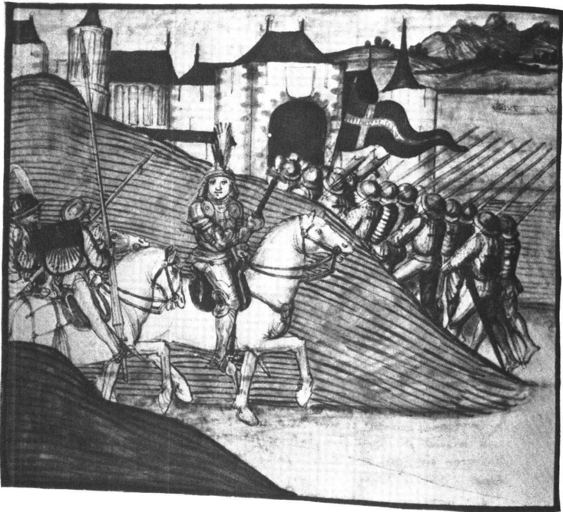
Abb. 12 Adrian von Bubenberg auf dem Zug nach Murten (Berner Schilling, Bd. 3, S. 692)

re Kappen abgezählt erhalten 84 . Noch verhasster sind ihm die «vffwiggler, houptlüt und hinfüerer», die heimlich ahnungslose Burschen nach Frankreich verschachern 85 . Doch verschont sein Tadel auch die Knechte selbst nicht, die frei dorthin laufen, um natürlich betrogen zu werden; nur räumt er ein, das Verbot des Laufens habe nichts gefruchtet, «uss der ursach, das die knächt arm warend». Umso tragischer das Schicksal solcher Gesellen, die dann zerlumpt und verkrüppelt aus dem französischen Dienst in die Heimat zurückkehrten 86 .