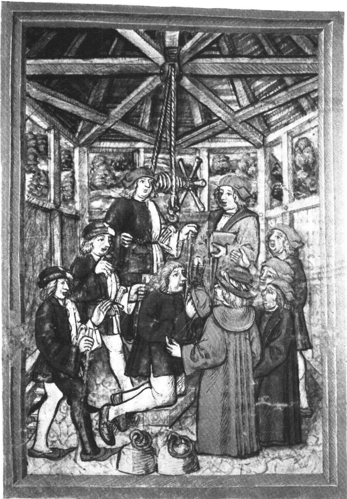
Abb. 8 Befragung des Peter Amstalden im Luzerner Wasserturm (Luzerner Schilling, fol. 129v)