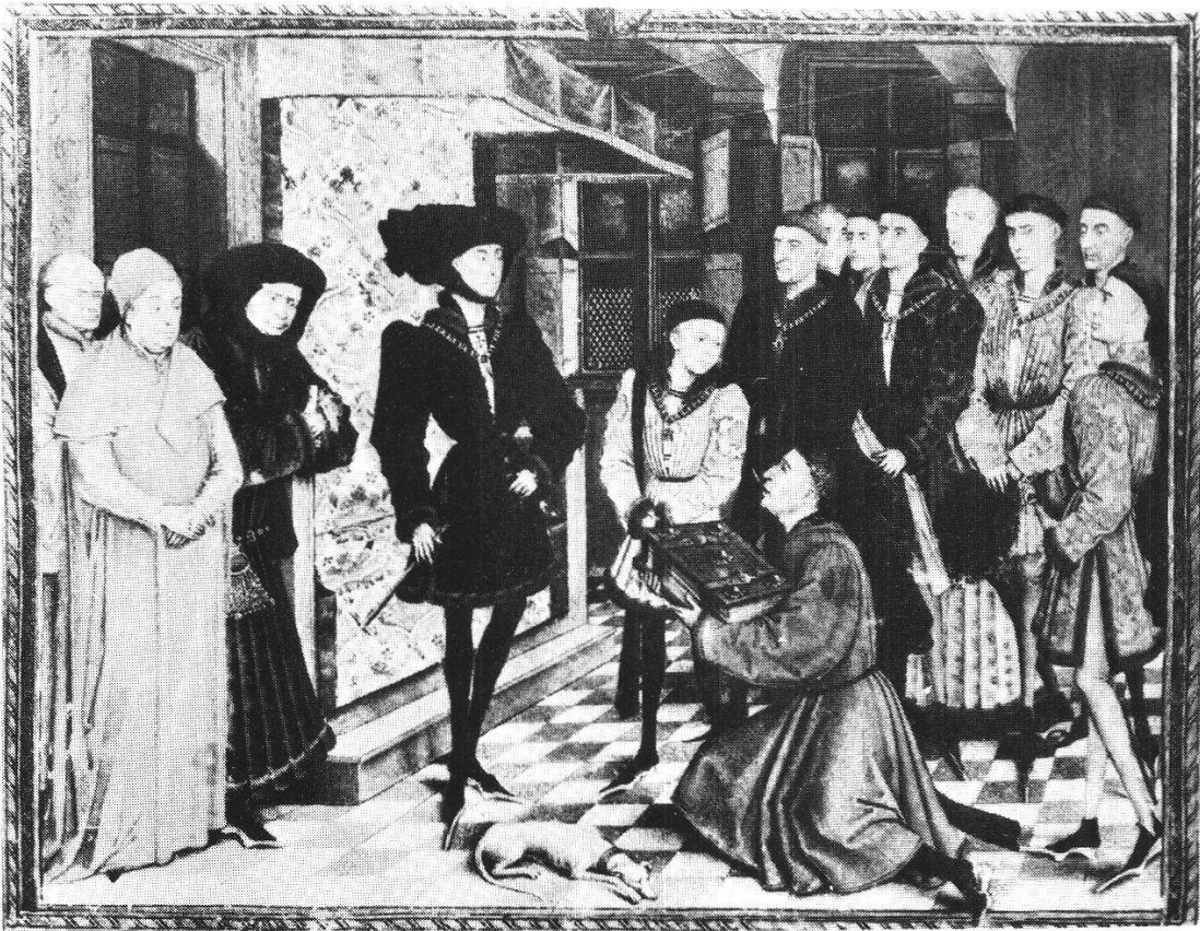
Abb. 5 Der Herzog von Burgund nimmt die Chronik des Hennegau entgegen (Propyläen Kunstgesch., Bd. 7, Abb. 3)

nem bürgerlichen Wohnraum auf umlaufender Holzbank Platz genommen. Statt Pagen und Zeremonienmeister versehen Weibel ihren Dienst. Stehend — ohne Kniefall — begrüsst der Kaplan seine Obrigkeit. Wohl entblösst er vor den sitzenden Räten — was eine gewisse Unterordnung andeutet—sein Haupt, doch hat er sein Birett vertraulich auf dem Ratstisch deponiert. Diesen Raum gibt er in der Folge mit geringen Varianten noch mehrfach wieder, weil ihm fast mehr als dem Rathaus im ganzen die Funktion der innersten Herzkammer des Staates zugekommen ist. Ohne Zweifel sind hier dem Luzerner wie sonst keinem seiner Zeitgenossen wahre Sinnbilder des republikanischen Gemeinwesen samt ihrer sie beherrschenden Honoratiorengesellschaft geglückt 50 .