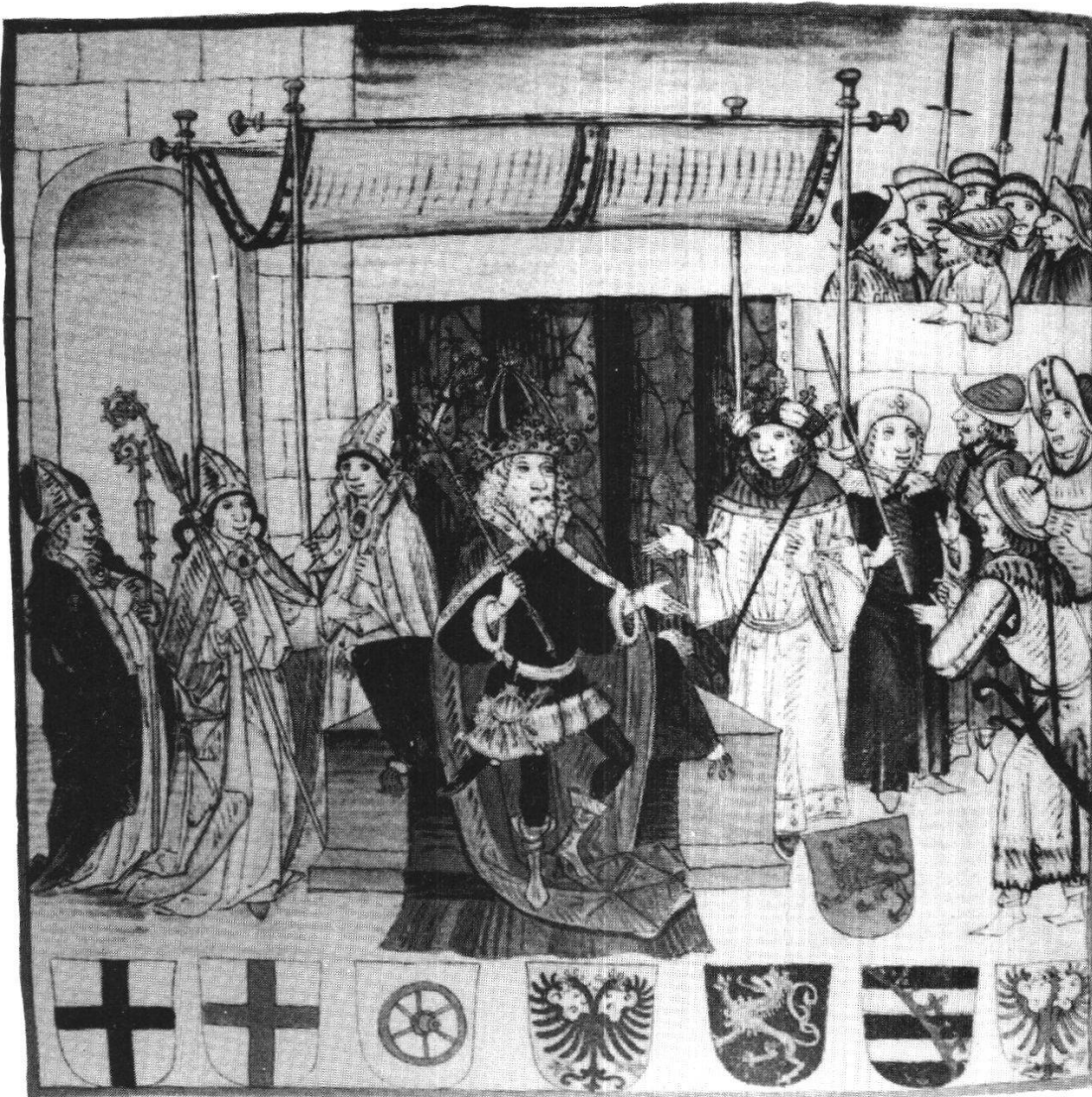
Abb. 1 Der thronende König Sigismund, von Kurfürsten umgeben (Berner Schilling, Bd. 1, S. 333)

vornehmster Verteidiger des deutschen Reiches vor fürstlicher Anmassung im Kampf gegen den «welschen Wütrich und blutvergiesser» 18 . Freilich wechselte das Verhältnis zu den einzelnen Herrschern je nach dem, wie sich diese zur Stadt verhielten 19 . Jene Könige und Kaiser, welchen die Stadt wichtige Privilegien verdankte, werden beim Berner mit eigentlichen Majestätsbildern- dem thronenden Herrscher inmitten der Kurfürsten u. ä. 20 - geehrt oder, und zwar bei beiden Chronisten, mit der Darstellung ih-