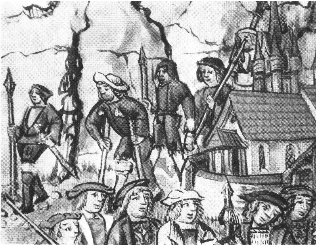
Abb. 13 Kriegsknechte kehren zerlumpt und verwundet in die Heimat zurück (Luzerner Schilling, fol. 279)

Eine grundsätzliche Kritik an der Reisläuferei und am Pensionenwesen kann man dem Luzerner trotzdem nicht zuschreiben. Die hier abgebildeten Knechte sind noch nicht zur Allegorie verdichtet, wie sie bald hernach Niklaus Manuel schaffen wird 87 . Der Luzerner registriert ganz sachlich, wenn die Gnädigen Herren mit den Werbegeldern «wol content» gewesen sind und die offiziellen Boten der inneren Orte in ländlicher Laube die Soldgelder Maximilians verteilen, «woran die drüy Lender ein gross wolgefallen hattend und erst geneigt wurdend im ze dienen» 88 . Er macht sich über die volkswirtschaftliche Bedeutung der fremden Dienste keine Illusionen, und im Grunde deckt sich seine Einstellung zum Söldner- und Pensionenwesen durchaus mit den Intentionen der Obrigkeit. In Zusammenhang mit der eingangs erwähnten inneren Konsolidierung strebten ja die Stadtorte schon seit etwa 1480 darnach, den Solddienst unter obrigkeitliche