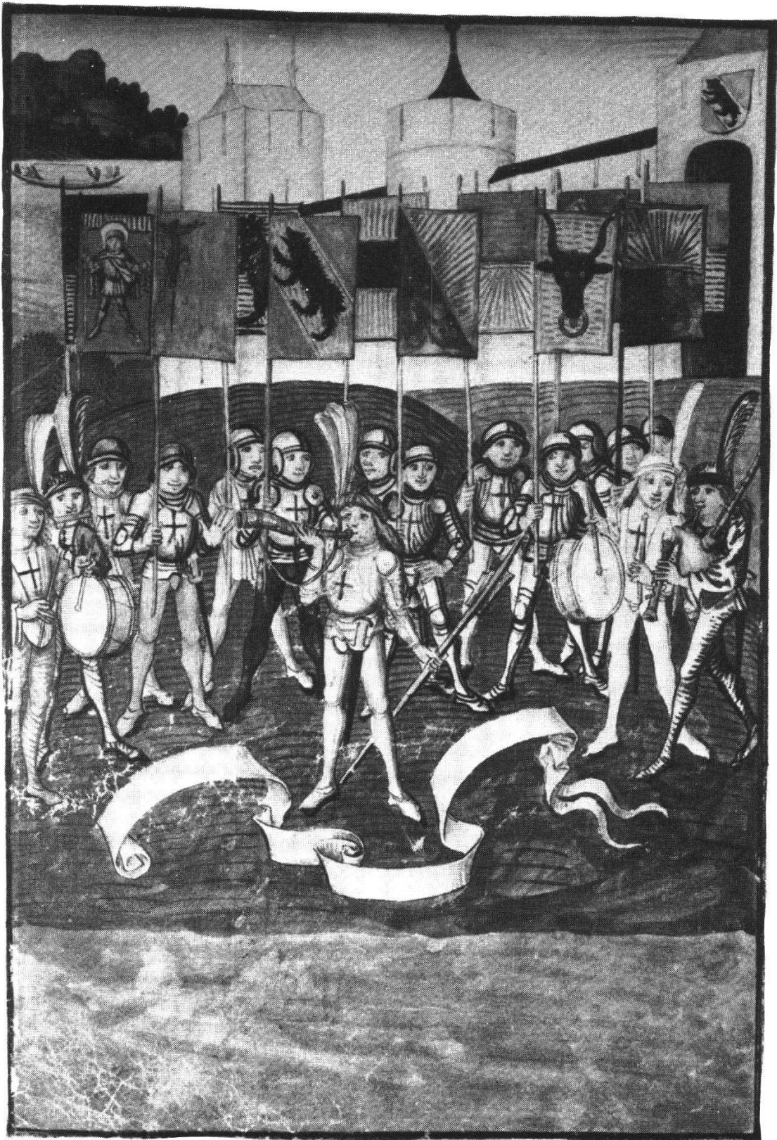
Abb. 2 Die Bannerträger der Zwölf Orte (Berner Schilling, Bd. 3, S. 8)