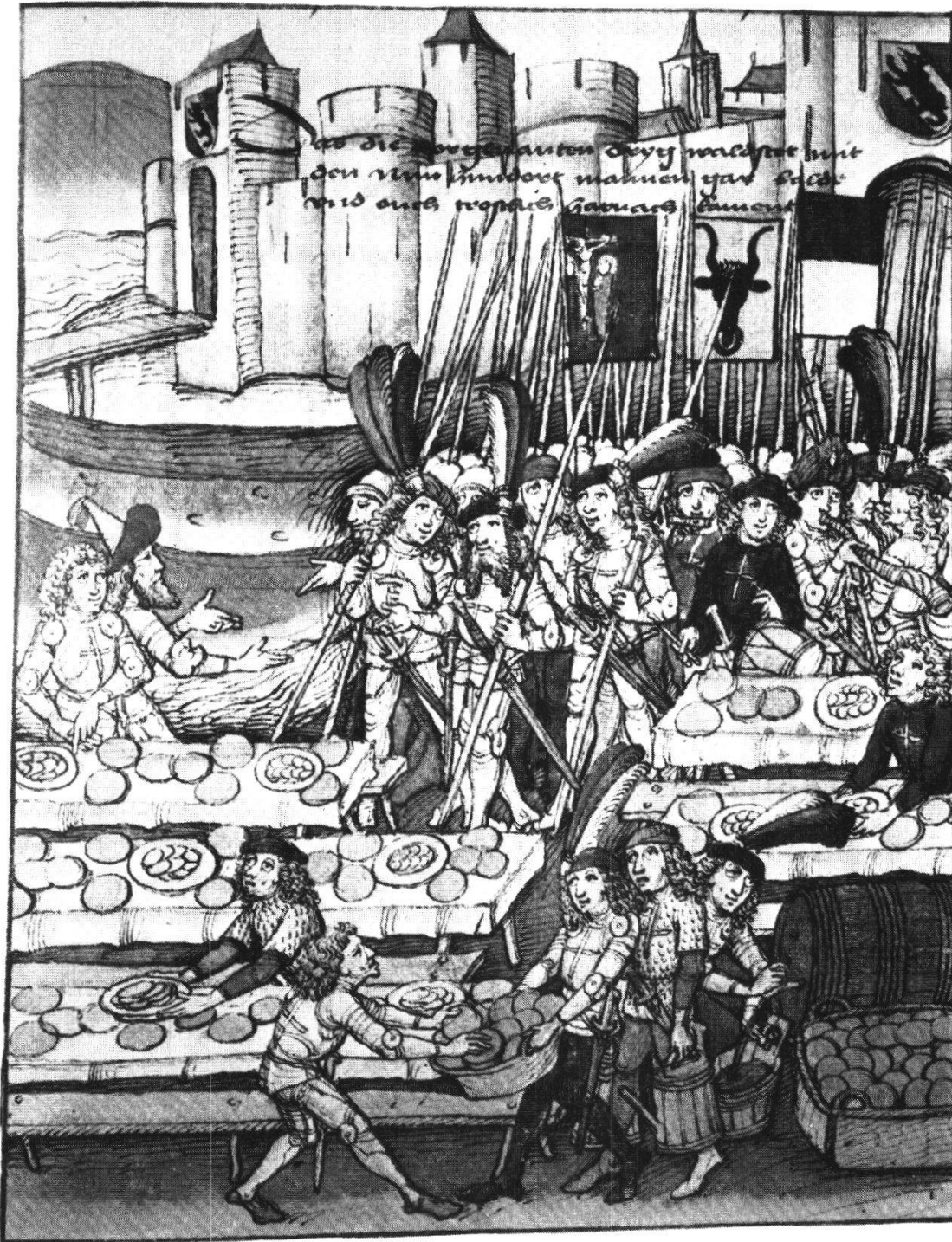
Abb. 9 Hilfstruppen aus der Innerschweiz werden in Bern festlich bewirtet (Spiezer Schilling, Tafel 122)