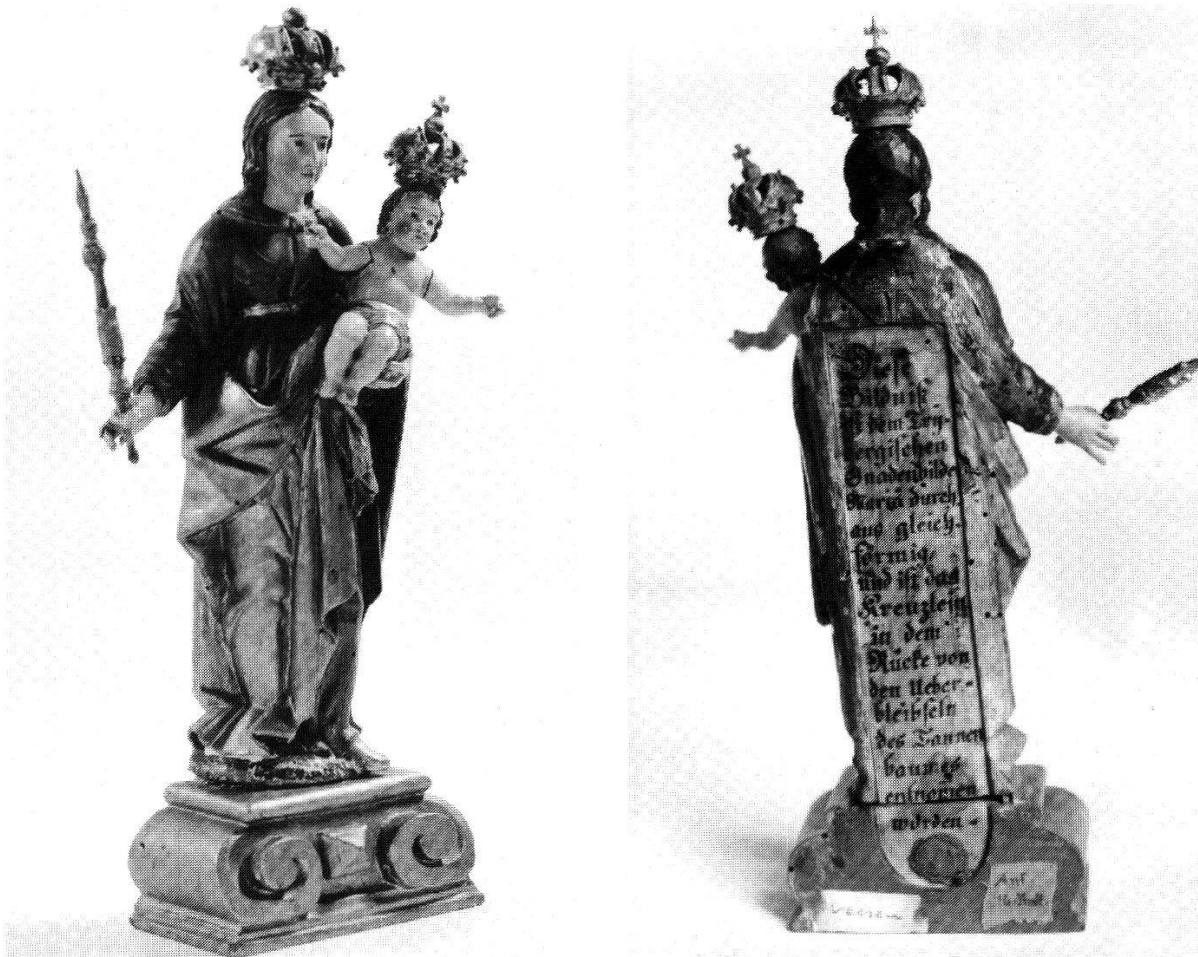
Abb. 98, 99:

Maria in der Tanne. Barocke Devotionskopie des Gnadenbildes in der Wallfahrtskirche Triberg im Schwarzwald. In die Rückseite eingelassen ein Kreuzlein von der ehrwürdigen Tanne, in der das Gnadenbild anfänglich aufgestellt gewesen war, darunter Authentik-Inschrift mit Siegel. Dominikanerinnenkloster Weesen SG.