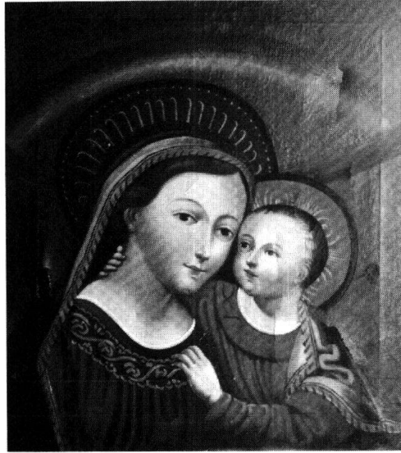
Abb. 94, 95:

Maria vom guten Rat. Kopie des Sekundärgnadenbildes im Zisterzienserstift Stams in Tirol mit einer auf die Leinwandrückseite geschriebenen Authentik, datiert 24. Juni 1760. Dominikanerinnenkloster Weesen SG.