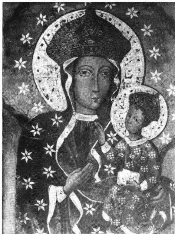
Abb. 253: Madonna von Tschenschow (Polen), Wallfahrtskirche. Bis auf die Gesichter und Hände mit Metall und Stoff verkleidete Marienikone. Die Datierungen schwanken von frühchristlich bis 15. Jh.; technischen Untersuchungen zufolge soll die Ikone nicht nach dem 9. Jh. entstanden sein. Anstelle des Originals ist hier eine Kopie im Benediktinerkloster Engelberg OW abgebildet.