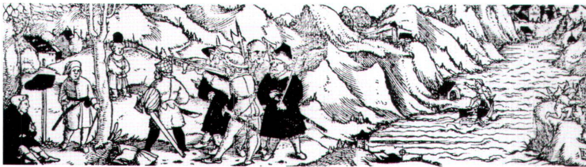
Erste Telskapelle am See. Mit Tellsprung. Holzschnitt um 1540.