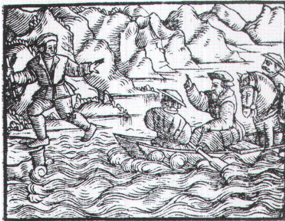
Urner Tellspiel. Gedruckte, erweiterte Fassung von 1545, mit älterer Holzschnittfolge der Tells- und Befreiungsgeschichte.