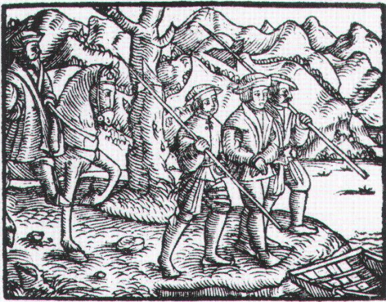
Urner Tellspiel. Gedruckte, erweiterte Fassung von 1545 mit älterer Holzschnittfolge der Tell- und Befreiungsgeschichte: Der gefangene Tell wird in Flüelen aufs Schiff gebracht.