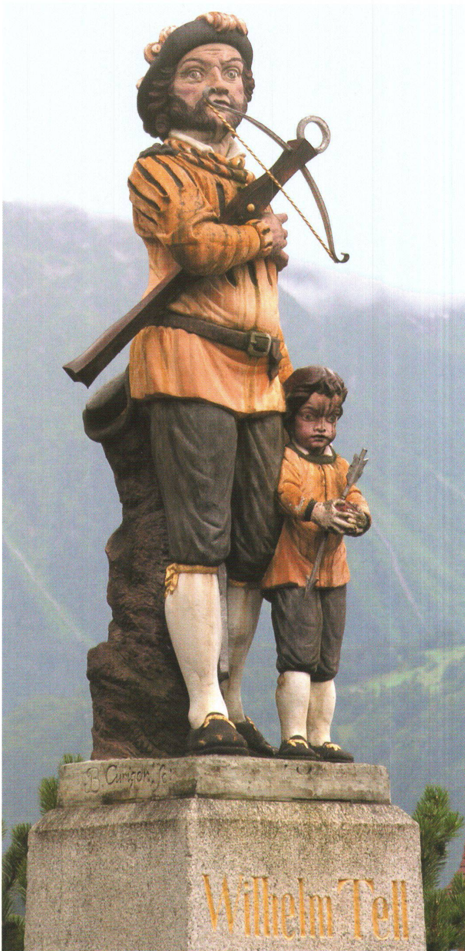
Abb. 3: Das Tellden- mal von Joseph Bene- dikt Curiger von 1786, heute auf dem Kirch- platz in Bürglen.