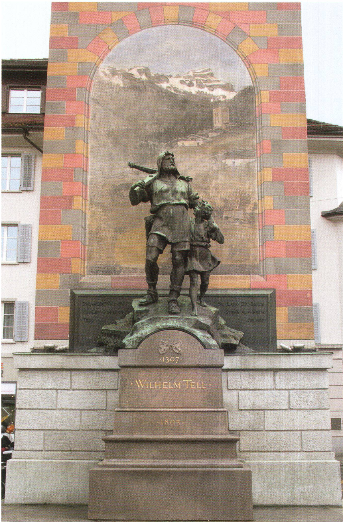
Abb. 5: Das Telldenkmal von Richard Kissling von 1895 vor dem Türmli in Altdorf.