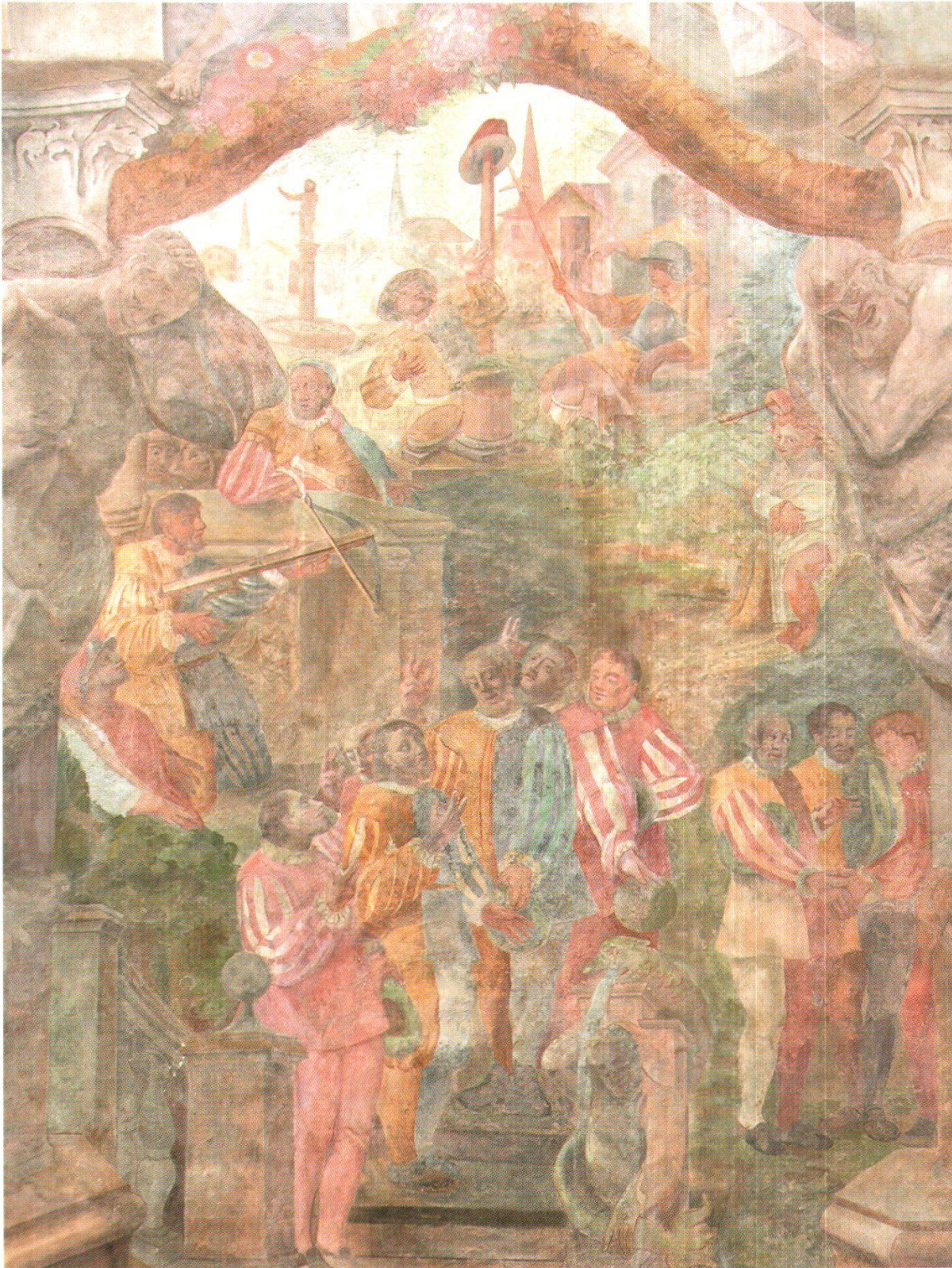
Abb. 2: Das Fresko von Karl Leonz Püntener von 1694 am Türmli in Altdorf.

1517 ins Eigentum des Landes Uri. In Nachahmung vieler bekannter Vorbilder, in den Städten Italiens etwa, aber auch nördlich der Alpen, in Luzern beispielsweise, baute der Stand Uri neben dem Rathaus, das 1508 am heutigen Standort belegt ist, einen imponierenden Turm. Rathaus und Turm gehören zusammen