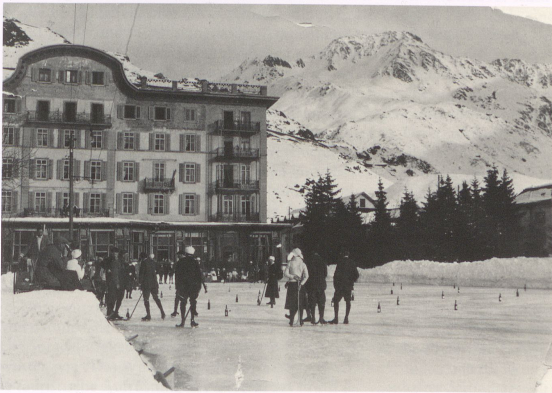
Abb. 1: Hotelgäste auf dem Eisfeld des Grandhotel Bellevue Palace in Andermatt. Ansicht von Westen. Undatierte Fotografie um 1913.