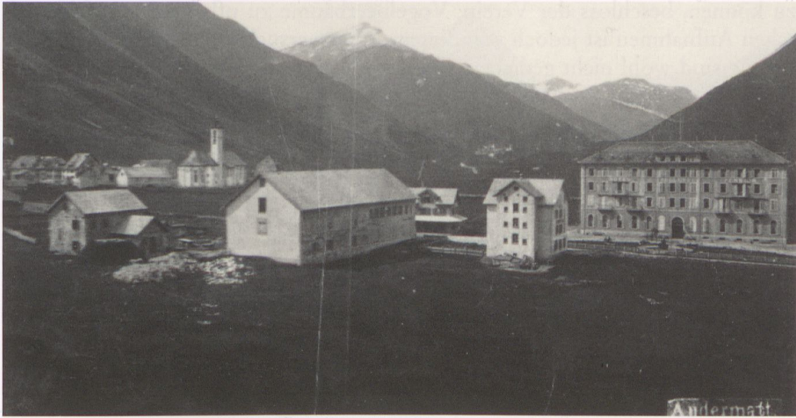
Abb. 2: Sicht von Osten in das karge Urserntal. Im Vordergrund steht das neu gebaute Hotel Bellevue, das mit Hotel Pension Bellevue beschriftet ist. Am linken Bildrand zwischen dem kleinen Waschhaus und dem länglichen Remisegebäude ist noch der zylindrische Kalkbrennofen der Baustelle zu sehen. Undatierte Fotografie um 1875. Privatarchiv Familie Müller, Andermatt.