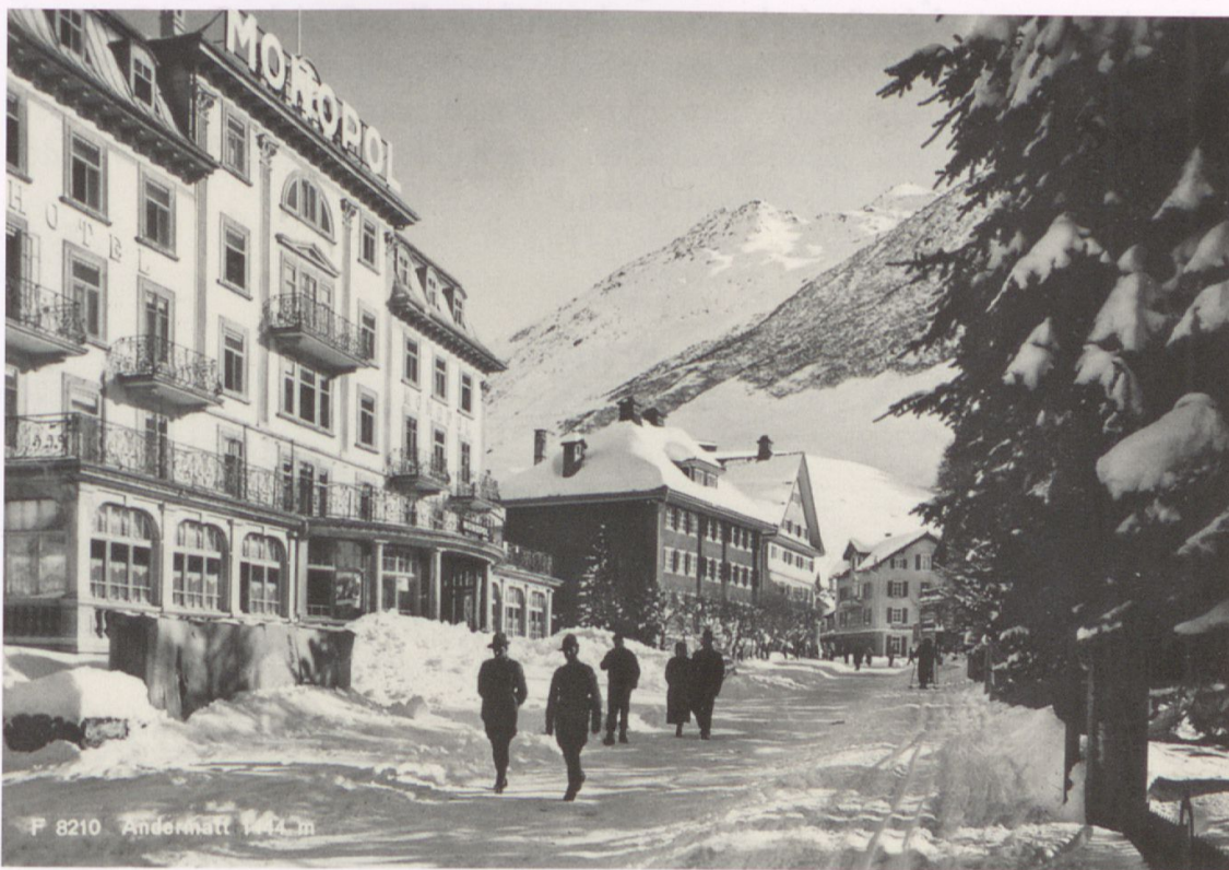
Abb. 6: Blick von Norden nach Andermatt. Der Dorfeingang wurde durch die Hotels an der Einfahrtsstrasse wie links dem Hotel Monopol neu definiert. Undatierte Fotografie um 1920.

des Hauses in der Landschaft, er baute auch in bewusster Distanz zum Dorf. Der in sich geschlossene Gebäudekomplex des Bellevue mit Hotel, Dependance, Apartmenthaus, Wirtschaftsgebäude, Garagen/Ställe, Hotelpark, Kiosk – und später auch noch mit einer Fischerhütte auf der Oberalp als Aussenstation – gruppierte sich um die Einfahrtsstrasse und empfing die von Norden kommenden Reisenden quasi in einem urbanen Ensemble vor dem alten Dorfkern. Mit seiner strategischen Lage definierte das Hotel den nördlichen Dorfeingang neu und veränderte damit die Wahrnehmung des alten Dorfbildes. Der Kontrast des neuen mächtigen, modernen und hellen Steinbaus mit der grosszügigen Parkanlage liess das alte Dorf dahinter kleiner und enger erscheinen – er stellte dieses quasi in den Schatten. Das neue Hotelareal verdoppelte die damals überbaute Fläche von Andermatt. 35