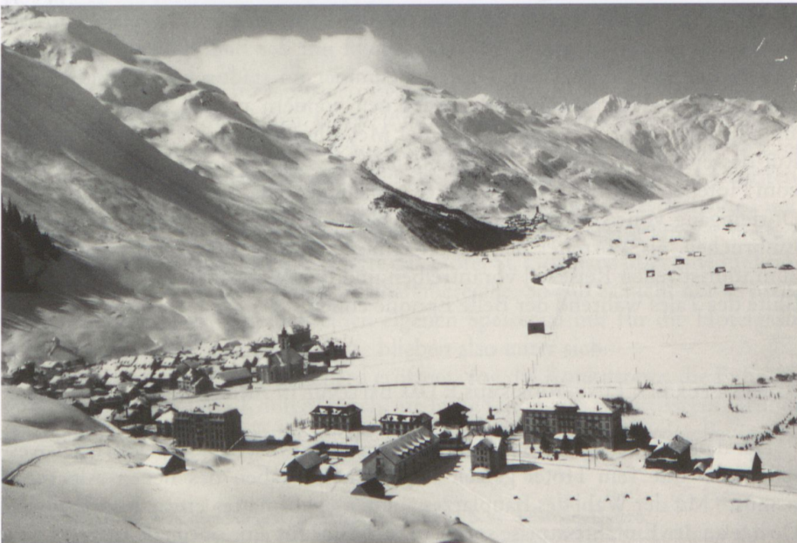
Abb. 5: Blick von Osten in das Urserntal mit dem Hotelensemble des Grandhotel Bellevue und dem neu gebauten Hotel Monopol, die zusammen den nördlichen Dorfeingang von Andermatt bestimmen. Am süd-westlichen Dorfausgang ist das Grandhotel Danioth erkennbar. Undatierte Fotografie um 1905.