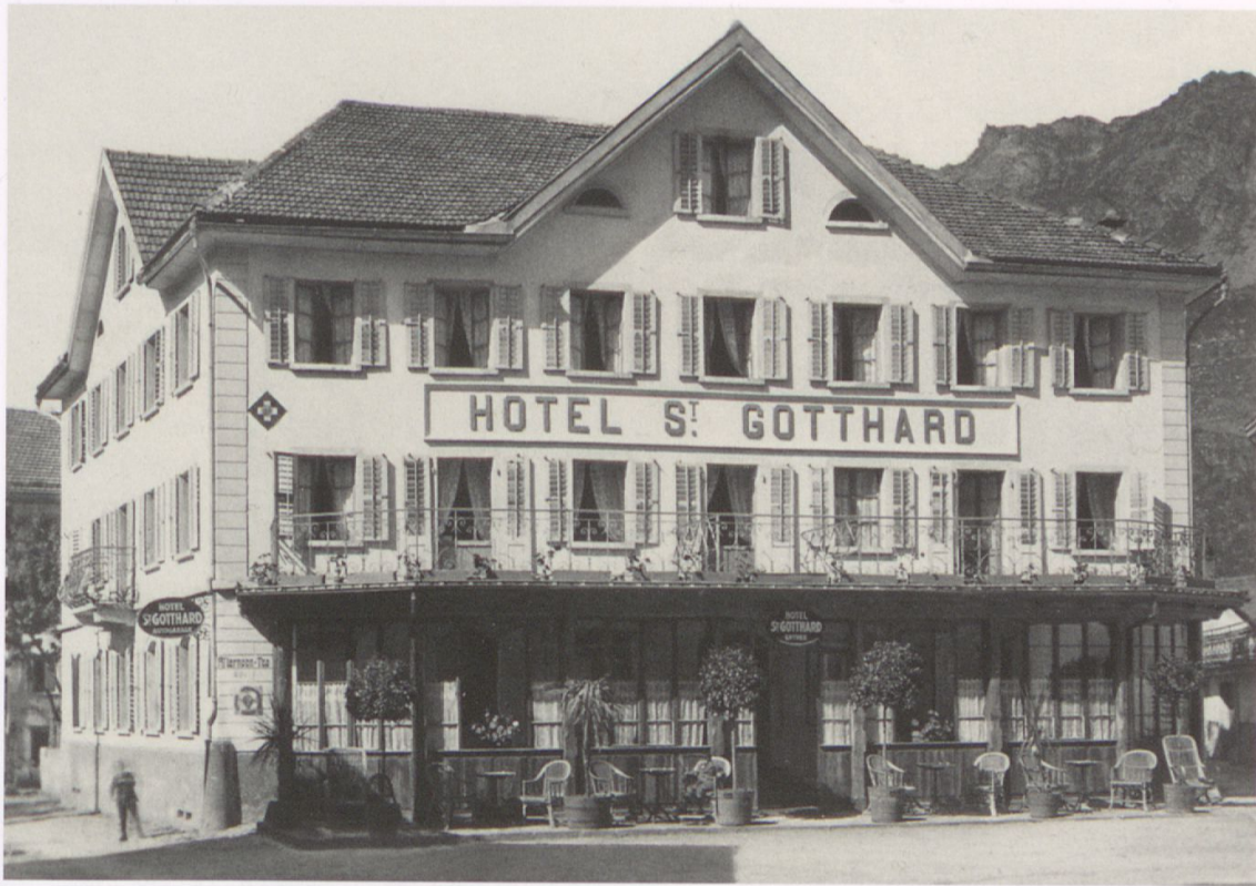
Abb. 3: Das Hotel St. Gotthard in Andermatt. Undatierte Fotografie um 1905.

übertrumpfte sie die Familie Christen mit der Eröffnung des wesentlich grösseren Hotels Meyerhof gleich mehrfach. Nicht nur der Bautypus war mit seiner Grösse und der Ausstattung seiner 70 Zimmer im städtischen Architekturstil und in seinem Repräsentationsanspruch neu, sondern auch die Lage des Hotels am Dorfrand war ein Novum. Doch der Meyerhof genoss nur wenige Jahre den Ruf des ersten Hauses im Tal. Bereits 1872 zog der Sohn der Familie Christen vom Hotel St. Gotthard mit seinem Hotelneubau, dem Bellevue, am nördlichen Dorfeingang von Andermatt nach. Das Bellevue sollte, abgesehen von einigen Einbrüchen, als Vorreiter den ersten Umbau vom Durchgangsort Andermatt zum touristischen Reiseziel vorantreiben und den Weg zur ersten touristischen Blüte des Tales während der Belle Epoque ebnen.