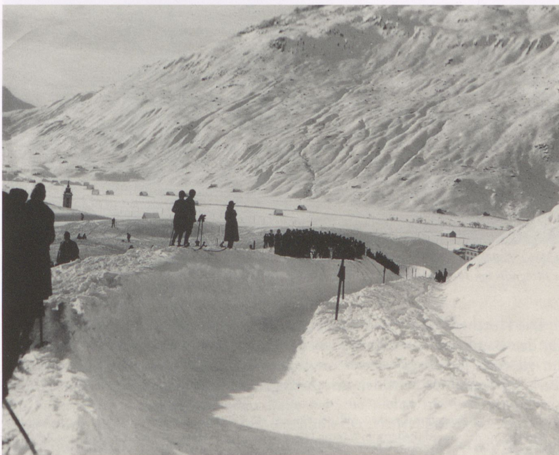
Abb. 9–11: Wintersport in Andermatt. Undatierte Fotografien um 1915 (Abb. 9), 1910 (Abb. 10) und 1920 (Abb. 11).