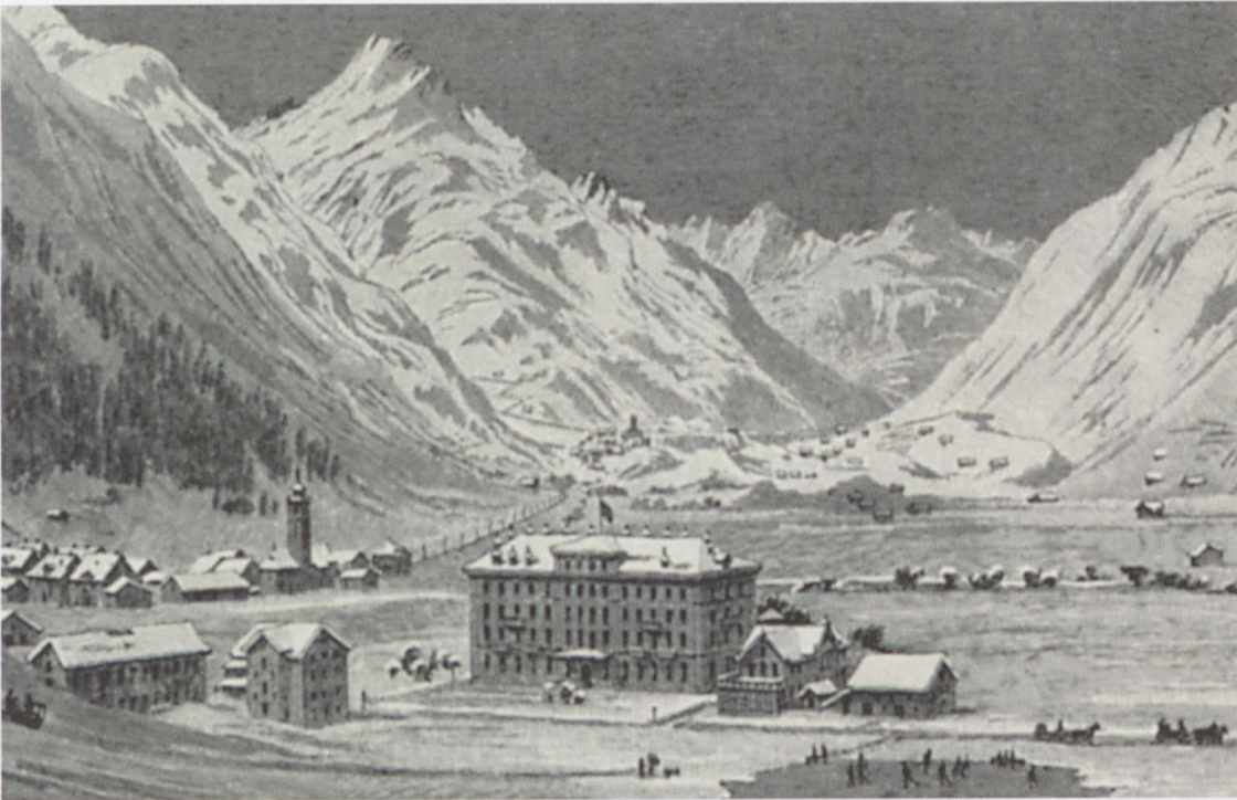
Abb. 4: Hotel Kurhaus Bellevue mit Eisfeld. Am südlichen Bildrand ist das alte Dorf Andermatt mit der Kirche und dem Bannwald und im Hintergrund das Dorf Hospental zu sehen. Lithographie von I. Weber datiert vom 6. April 1887, abgedruckt im Hotelprospekt «Hotel und Kurhaus Bellevue in Andermatt am St. Gotthard» von Sebastian Christen-Kesselbach. Privatarchiv Familie Müller, Andermatt.