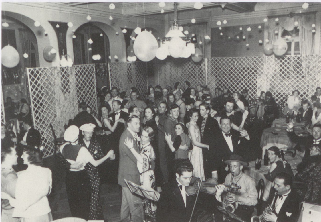
Abb. 12: Ball im Grandhotel Bellevue Palace mit dem hoteleigenen Orchester im Vordergrund. Undatierte Fotografie um 1920.

In der Folge etablierte sich das Urserntal zu einer beliebten Wintersportstation. Die ehemals aus gesundheitlichen Gründen langsam spazierenden Kurgäste entdeckten ihre Vorliebe für den schnellen Wintersport, vor allem die englischen Gäste. Es wurden Bobbahnen und Eisfelder angelegt, Skirennen veranstaltet und Schlittenfahrten angeboten. Am Abend gab es rauschende Maskenbälle und die betuchten Touristen trafen sich mit den Skilehrern oder Bergführern zum urchigen Abend im Dorf. Alleine im Bellevue sorgten rund 60 bis 80 Angestellte während der Saison für das Wohl der maximal 80 Gäste. 49 Es folgte eine erneute Investitionswelle im Hotelbau. 1907 wurde das Hotel Monopol eröffnet, 1912 erhielt das Bellevue ein weiteres Stockwerk, einen Lift und den neuen Namen Grandhotel Bellevue Palace. Im gleichen Jahr erhielt das Grandhotel Danioth seinen westlichen Anbau und wurde ebenfalls gründlich renoviert und aufgestockt. 50