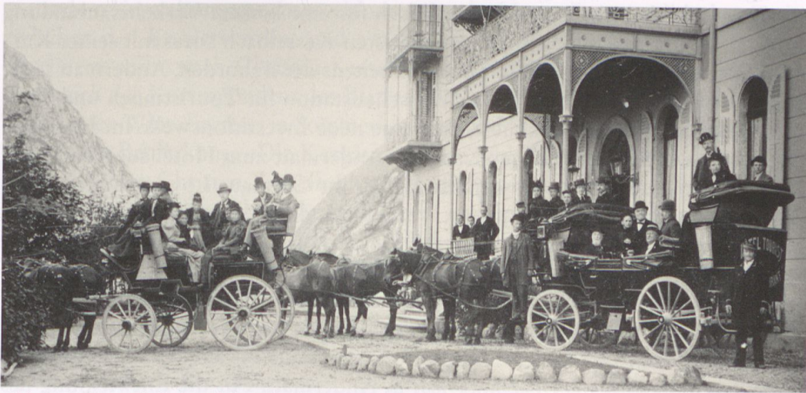
Abb. 8: Reisegesellschaft auf der Durchreise in Andermatt. Undatierte Fotografie um 1885.

Die neuen Hotels im Urserntal verzeichneten bis 1882 einen erfolgreichen Geschäftsverlauf. Während das Transitgeschäft auf Hochtouren lief, mussten sich die Urschner Geschäftsleute nicht weiter um geschäftsfördernde Massnahmen bemühen. Das 1872 eröffnete Bellevue, das sich bei den gut situierten Reisenden schnell grosser Beliebtheit erfreute, machte sich in seinen ersten Betriebsjahren zudem einen Namen als standesgemässer Ausgangsort für Besichtigungen der Jahrhundertbaustelle der Gotthardbahn in Göschenen und beherbergte die damalige politische und wirtschaftliche Prominenz der Schweiz. Zusätzlich erlangte das Haus durch den Aufenthalt von Mitgliedern des europäischen Hochadels das nötige internationale Renommee und wurde in der europäischen Oberschicht als geeignete Station auf dem Weg in den Süden empfohlen. 38