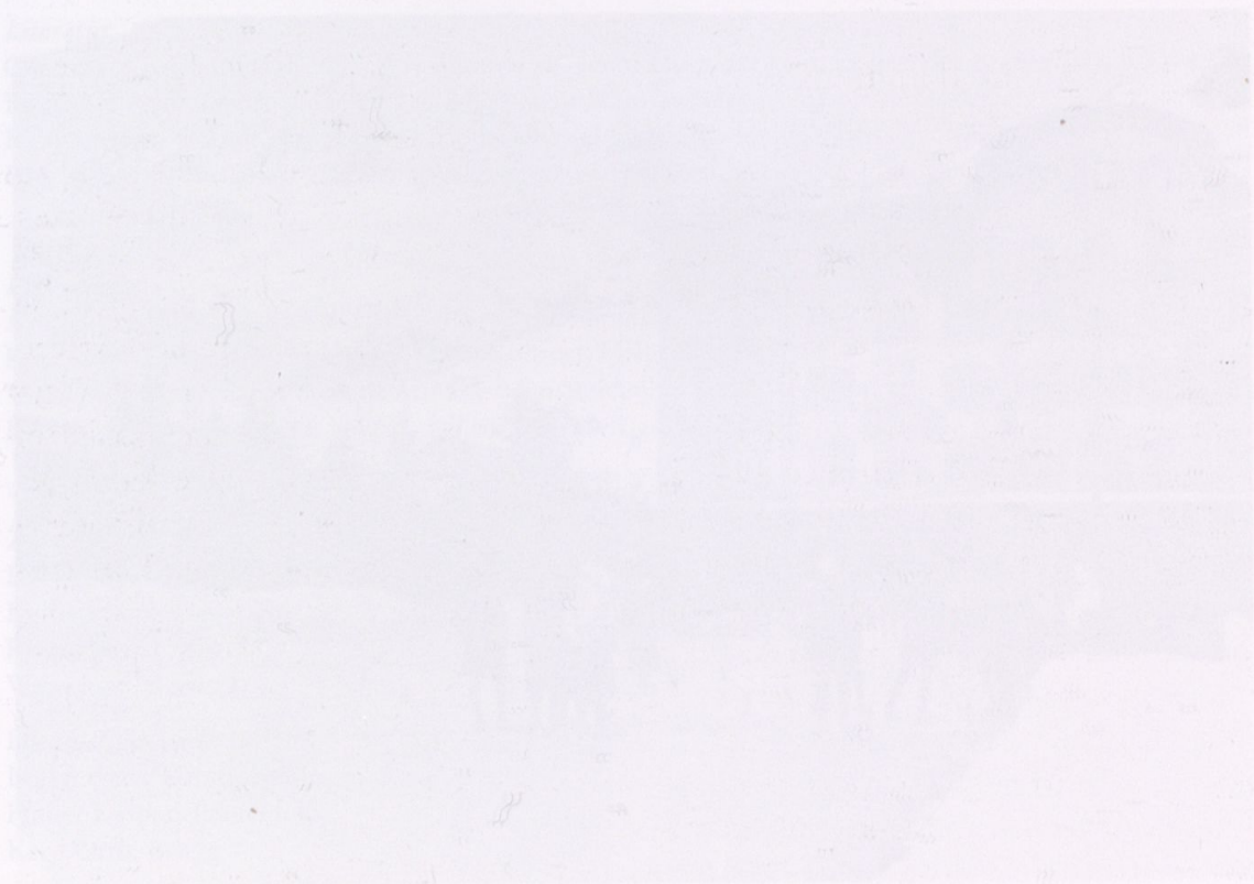
Abb. 1: Historische Aufnahme des Grandhotel Bellevue Palace in Andermatt, Schweiz, um 1910. Historische Fotografie aus dem Jahr 1910

Auszug: Flugpläne, Auszug von Flugplänen, Bericht des Hauptmannen vom 17. 1. 1914, Archiv: Eisenmuseum Dübendorf Auszug: Flugpläne, Erläuterungen vom 14. 1. 1914 Archiv: Eisenmuseum Dübendorf Bericht des Kommandanten der Flieger- und Flaktruppen an den Oberbefehlshaber der Armee über den Aktivdienst 1914-1918