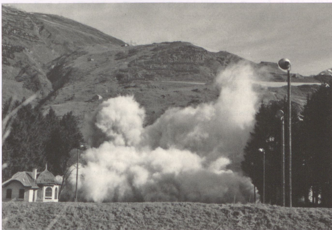
Abb. 13: Sprengung des ehemaligen Hotels Bellevue im Herbst 1986.

Kaum ein anderer Wirtschaftszweig erwies sich als so schnelllebig und krisenanfällig wie der Luxustourismus. Die Investitionen für die ständigen Renovierungen und Modernisierungen in den Zwischensaisons und die Anforderungen an