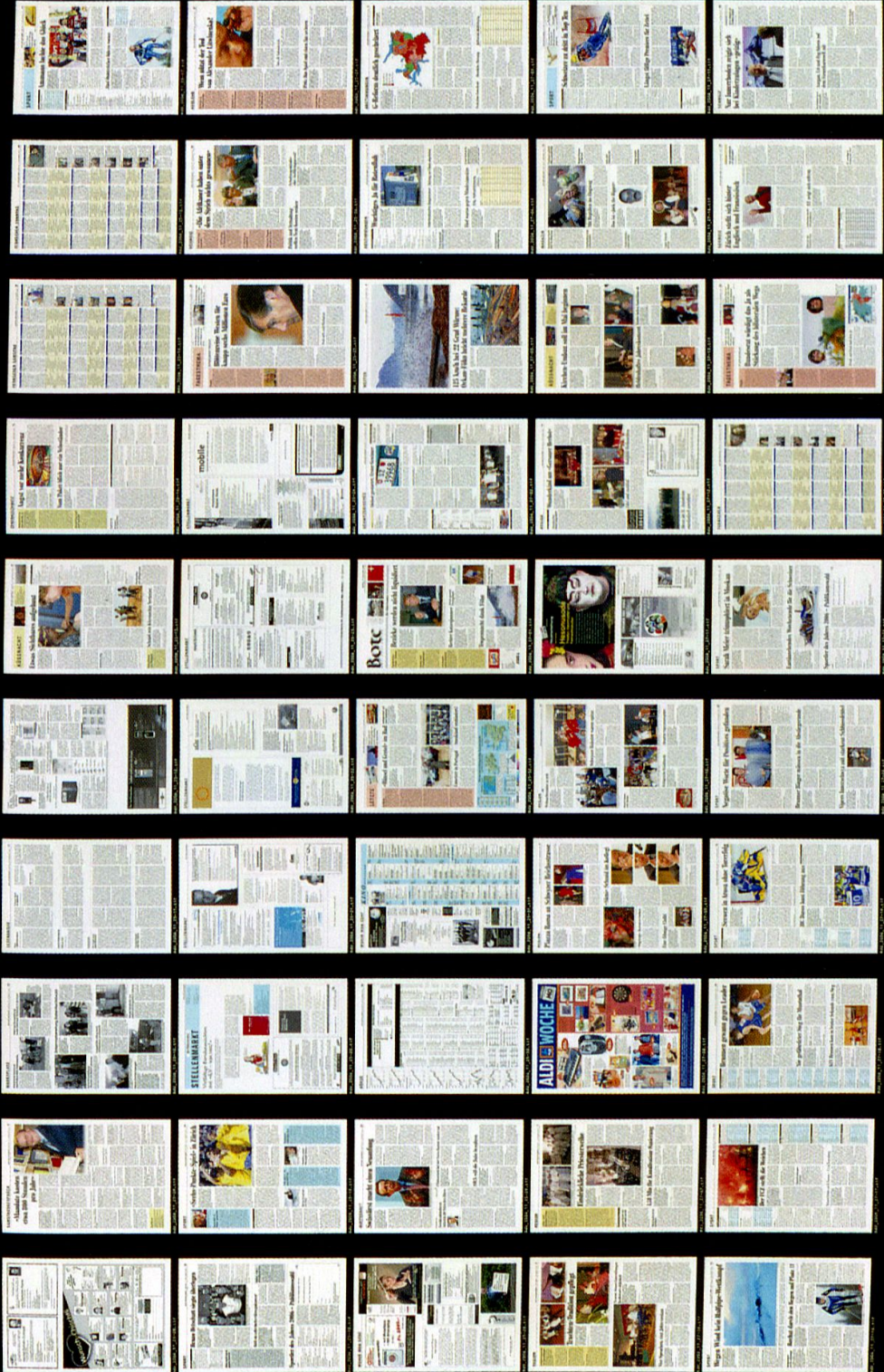
Eine Mikrofiche als Produkt der digitalen Sicherstellung.