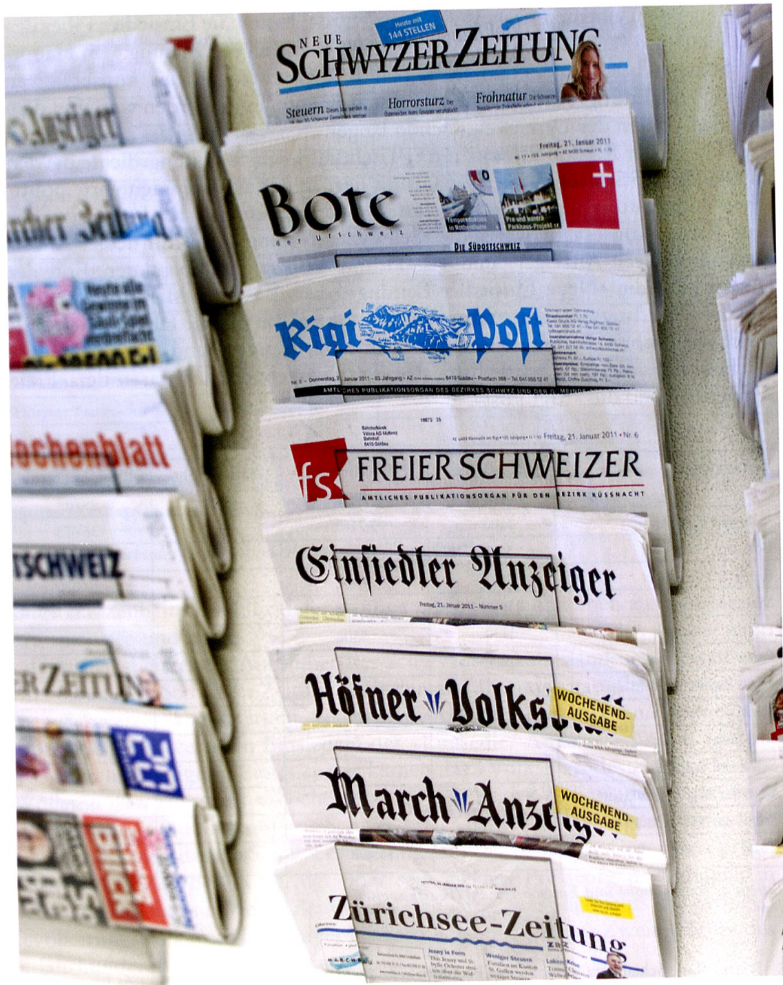
Die Pressevielfalt im Kanton Schwyz auf einen Blick.

Die Zeitungslandschaft von 1960 war vielfältig, was sowohl den politischen als den regionalen Aspekt betrifft. Zugleich aber war sie stark fragmentiert. Die Zeitungen richteten sich an ihre Klientel im regional-lokalen Einzugsgebiet. Eine gewichtige überregionale Stimme fehlte. Die christlichsozialen und sozialdemokratischen Presseorgane waren ideologisch und nicht regional ausgerichtet; sie