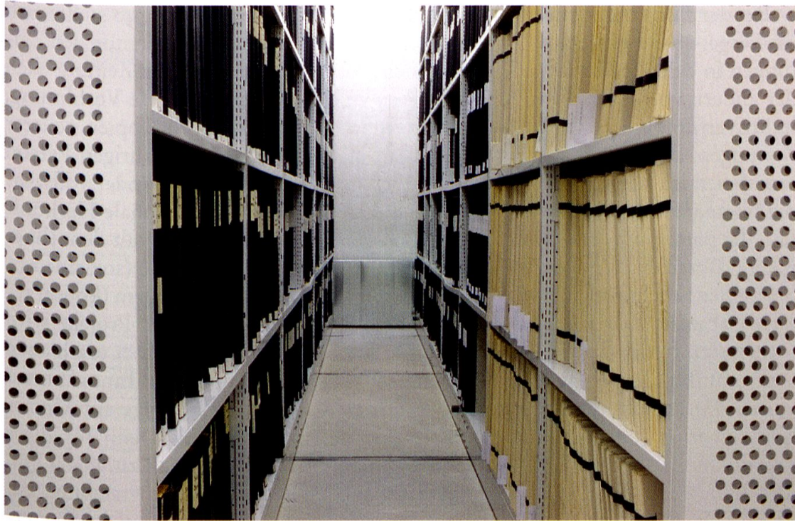
Ein Teil der Zeitungssammlung im Staatsarchiv Schwyz.

oben erwähnte Erleichterung für die Benutzer. Mittlerweile sind fast sämtliche Codices (handschriftliche Bücher) bis 1848, die Urkunden und die wichtigen Bücher nach 1848 (Kantonsrats-, Regierungsrats- und Gerichtsprotokolle sowie die Bücher der Departemente) auf Mikrofilm sichergestellt. Bei den Akten des Alten Archivs wurden erste praktische Erfahrungen gesammelt. Einen wichtigen Bestandteil bilden die Mikrofilme der Pfarreibücher – hauptsächlich Geburts-, Ehe- und Sterbebücher. Dieses Projekt wurde in Absprache mit den Pfarreien realisiert.