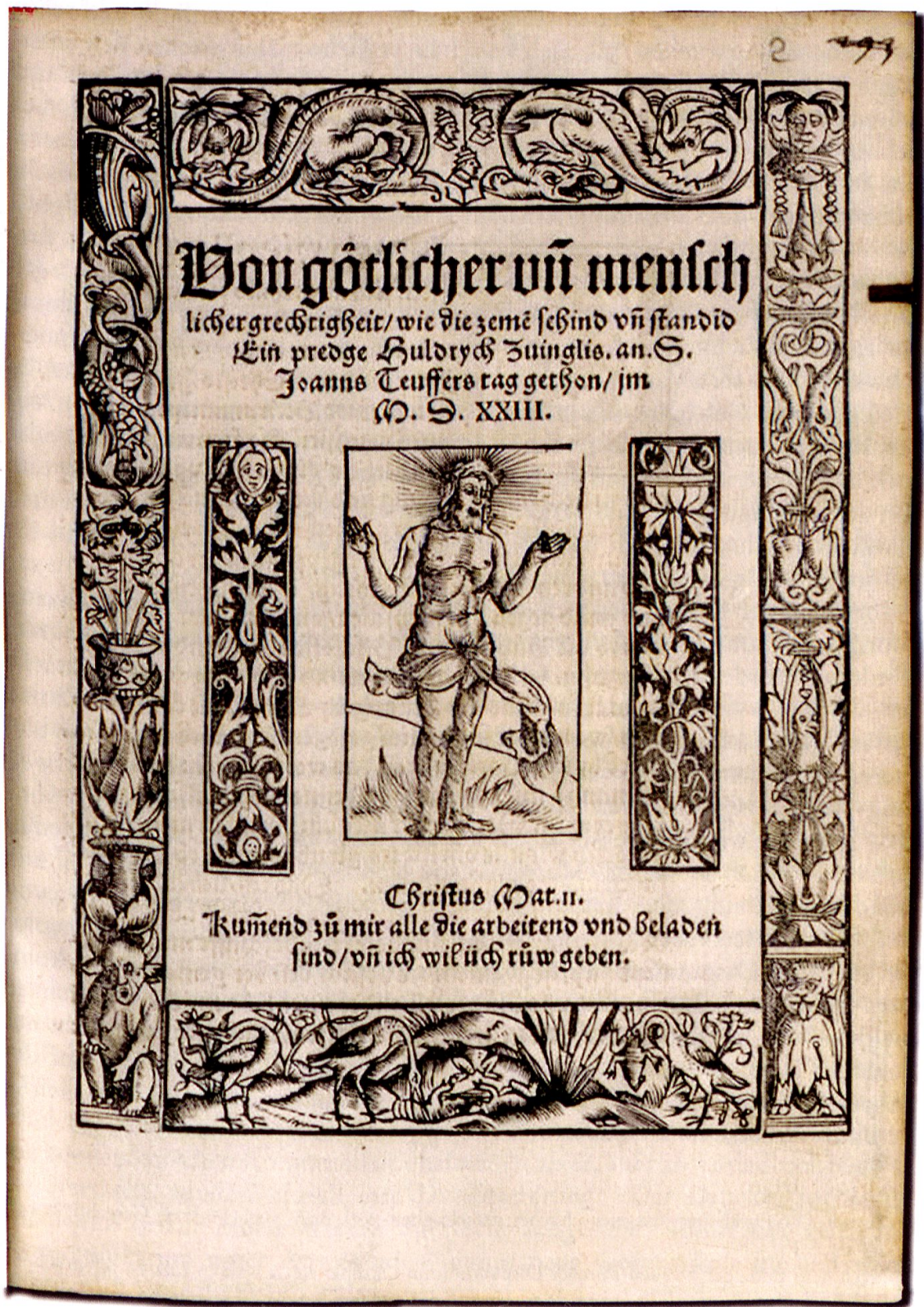
Abb. 6: Huldreich Zwingli, Von götlicher und menschlicher gerechtigkeit / wie die zemen sehind und standid, Zürich 1523, Titelblatt.