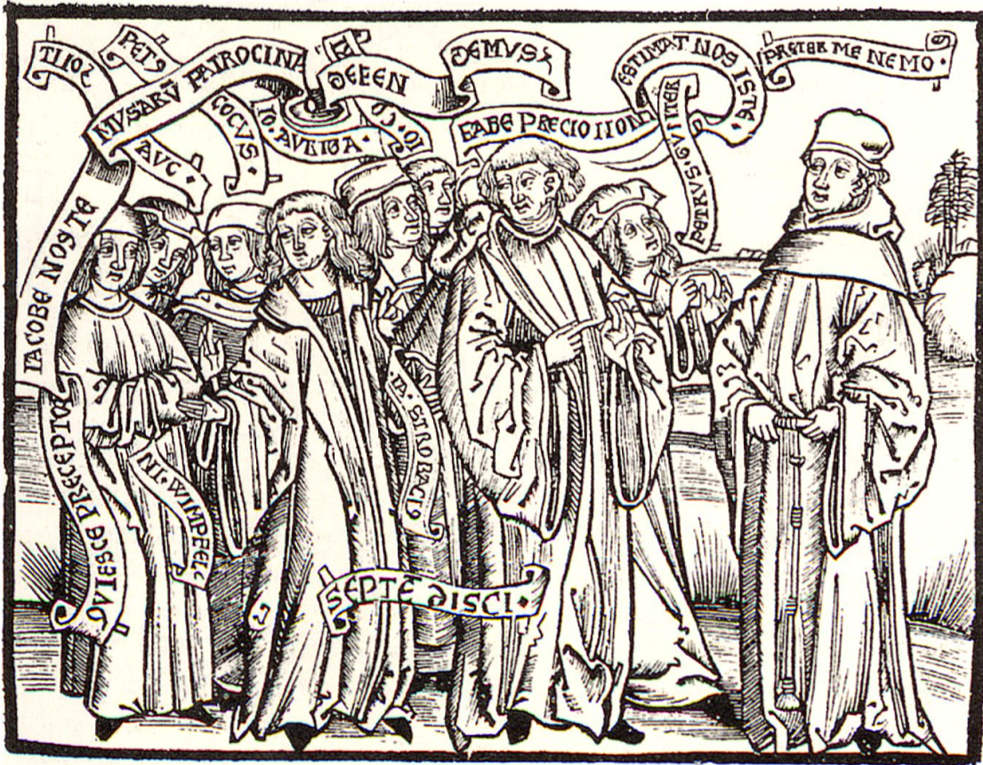
Abb. 1: Thomas Murner (rechts) im Gespräch mit Jakob Wimpheling und seinen Schülern, Titelblatt einer Flugschrift von 1502.

von Briefen kennen und hielt über Briefe Kontakt zueinander. 10 Im Medium des Briefes pflegte man eine gemeinsame Sprache und ein gemeinsames Anliegen. Man versicherte sich der gegenseitigen Zuneigung und Hochachtung sowie der Gemeinsamkeit im Geiste der Studien, insbesondere der klassischen Künste wie der Erneuerung der antiken Sprachen. Der Brief wurde somit als schöngeistiges Medium verstanden und, den Vorgaben der antiken Redekunst folgend, als ein kleines Kunstwerk inszeniert. Das hieß allerdings nicht, dass Humanistenbriefen nicht auch einem ganz konkreten Zweck dienen konnten. Häufig beinhalteten sie Informationen zum aktuellen Tagesgeschehen und Nachrichten über die jüngsten Entwicklungen in der Region des Verfassers. Zudem wurden ihnen immer wieder auch Bücher und Schriften beigelegt, um dem Adressaten die Möglichkeit zu geben, sich weiter zu informieren. 11