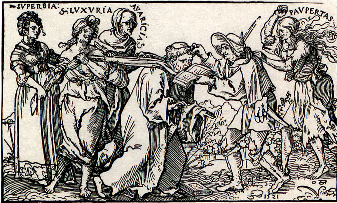
Abb. 5: Hans Sebald Beham, Allegorie auf das Mönchtum, Holzschnitt, 1521.

kationsform, also zum mündlichen Austausch unter körperlich Anwesenden. 22 Sie beinhalteten in der Regel nur einen kurzen Text, der mit einem Bild kombiniert war. Der Text selbst konnte vorgetragen oder vorgesungen werden; die Bilder, die sehr oft Aspekte der Alltagskultur aufgriffen, liessen sich szenisch nachstellen und theatralisch inszenieren. Auf diese Weise konnte in einfacher, dem «gemeinen» Mann und der «gemeinen» Frau verständlicher Weise gegen Rom und den ortsansässigen Klerus polemisiert, aber auch theologische Inhalte der Reformation vermittelt werden.