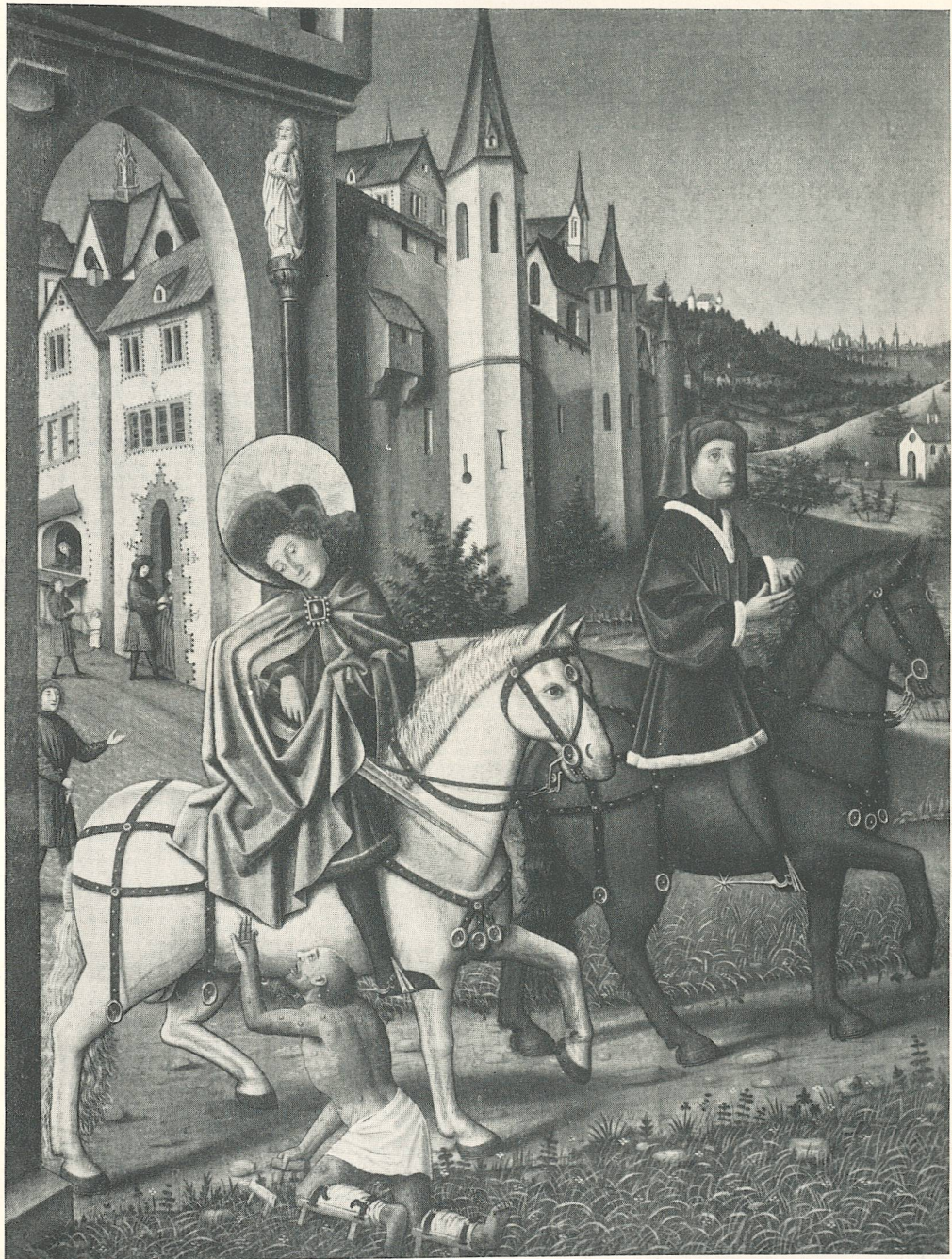
Nachfolger des Konrad Witz, Der hl. Martin.