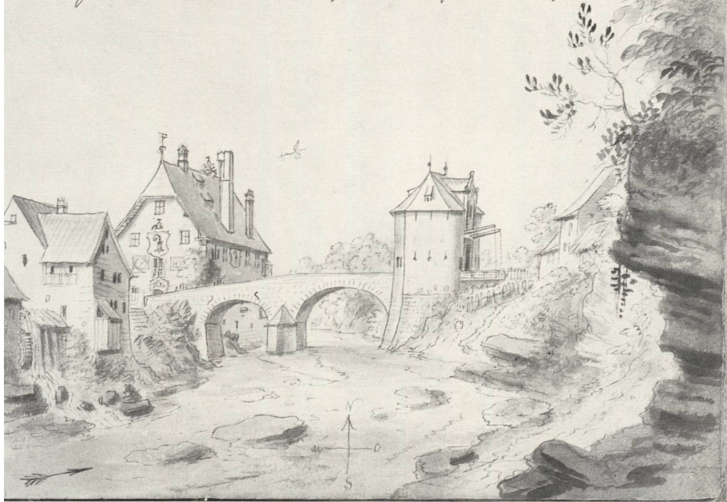
5 Ergolzbrücke in Augst, 1754

August an der Vauke, von Mittag an bis Pörfay, gezeichnet im Jahr 1754. 21