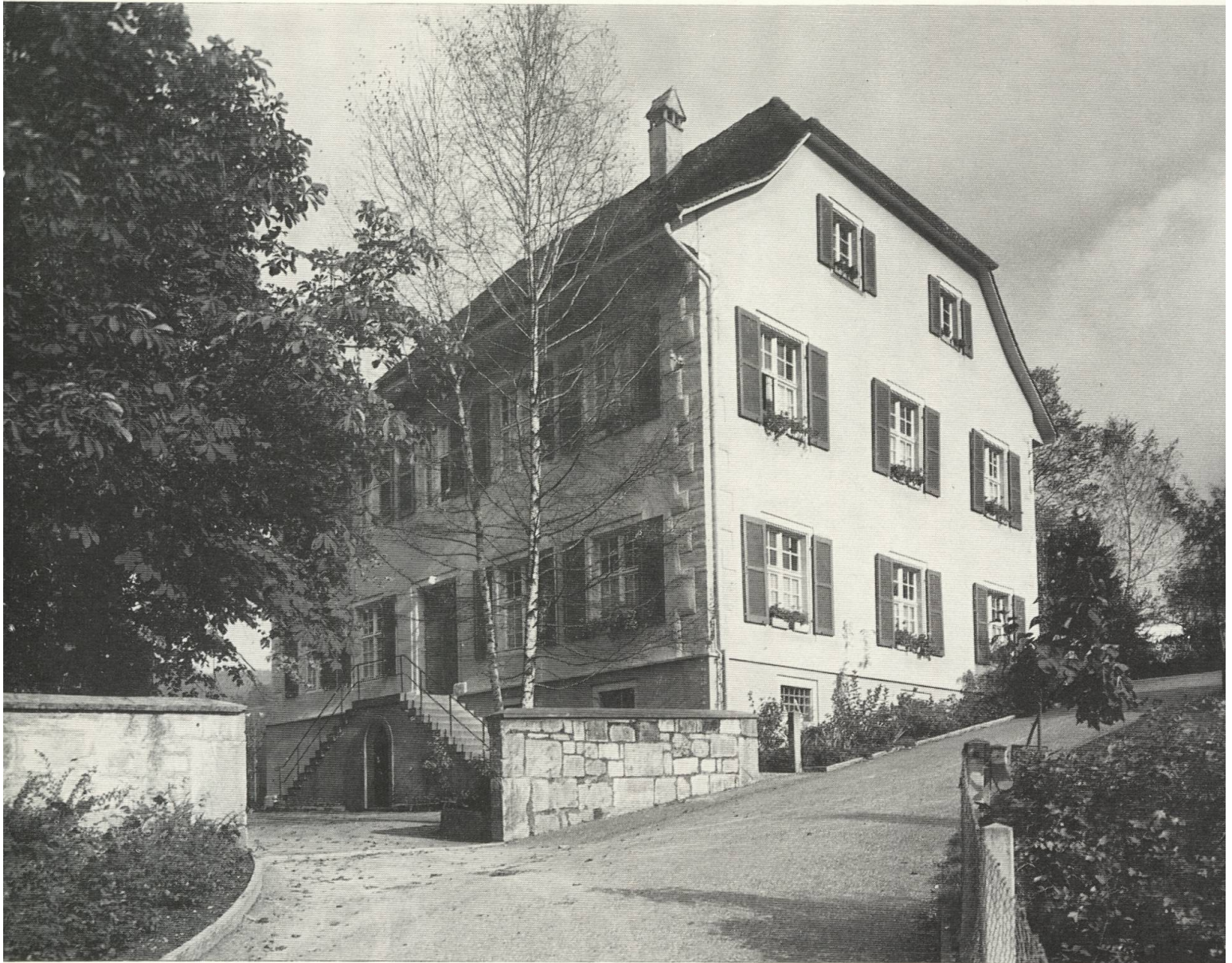
12 Pfarrhaus in Bretzwil