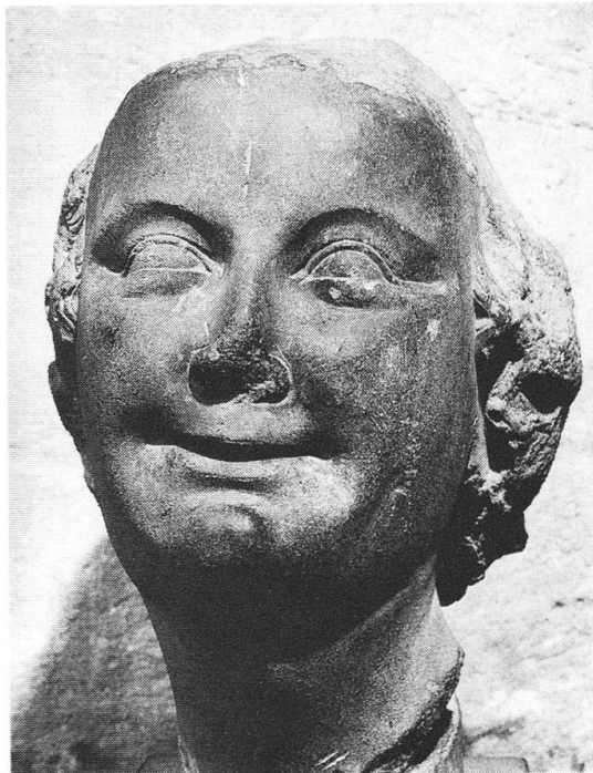
Abb. 14: «Lächelnder Frauenkopf», Kopf einer törichten Jungfrau aus der zerstörten Vorhalle des Basler Münsters, um 1290.

lung demgemäss in ihrer Gesamtheit in Erscheinung treten zu lassen. Dazu kommt, dass Teile der Sammlung, wie die romanischen Skulpturen, in der gedeckten Halle nur unbefriedigend verwahrt sind. Der grosse Saal des Kleinen Klingentals bietet demgegenüber einen geradezu prädestinierten Unterkunftsart für diese Bestände und passt sich idealerweise in den Gesamtrahmen der renovierten Gebäulichkeiten ein» 139 . Der Bitte wurde weitgehend entsprochen. Nur für acht Skulpturen verweigerte die Kommission die Bewilligung mit der Begründung, dass ihre Herkunft aus dem Bauegefüge des Münsters nicht beweisbar sei. Dies galt für zwei frühmittelalterliche Kapitelle 140 , die Fragmente von zwei Gewandfiguren 141 , den lächelnden Frauenkopf 142 , das Retabel des Annenaltars 143 , das Relief mit der Anbetung der Könige 144 und die Grabplatte Tierstein-Baden 145 .