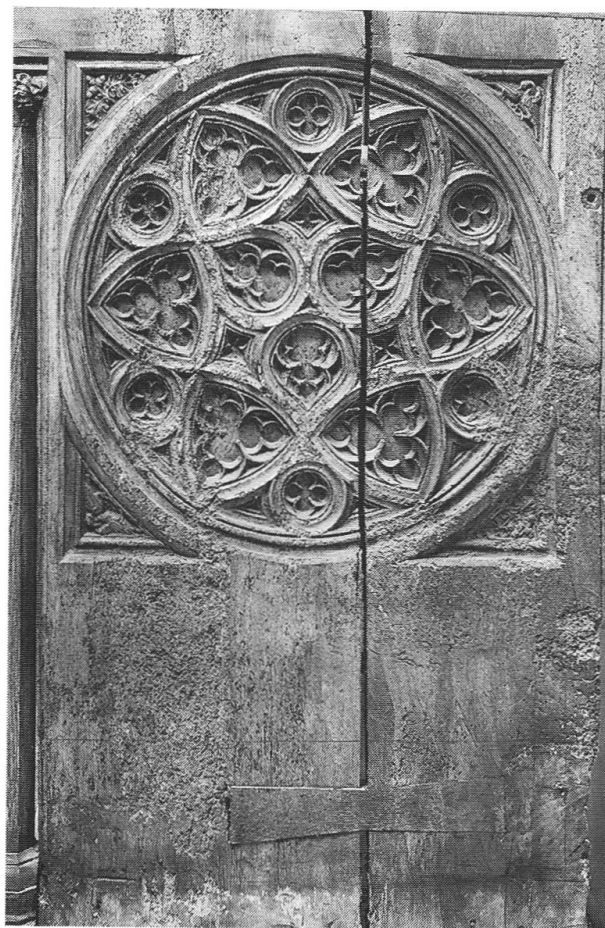
Abb. 17: Masswerk-Rosette auf einer Seitenwange des Chorgestühls aus dem Basler Münster, um 1350.

der St. Leonhardskirche dem Historischen Museum versprochenermaßen als Depositum überlassen wird, da er das eigentliche Gegenstück zu dem bei uns befindlichen Lächelnden Frauenkopf darstellt» 172 . Der vorgeschlagene Kompromiss wurde akzeptiert, das Historische Museum nutzte die Gelegenheit, seine Sammlung von antiquarischen Objekten zu entlasten und die eigene kunsthistorische Qualität zu steigern.