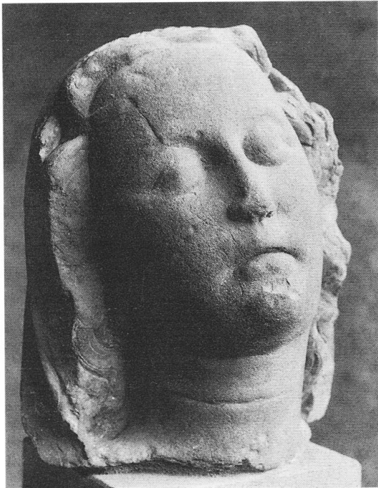
Abb. 13: «Klagender Frauenkopf», Kopf einer klugen Jungfrau aus dem Vorhallen-Zyklus des Basler Münsters, um 1290.