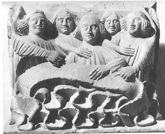
Abb. 15: Engelschor auf dem Leseputz vom (abgebrosenen) Lettner im Basler Münster, um 1380.

«soweit sie nicht an Ort und Stelle am Münster erhalten bleiben können» 155 . Deshalb bemühte er sich 1941 auch intensiv um die Rückführung eines Wasserspeiers vom Treppenturm des Martinsturms, der in die USA abgewandert war 156 . Anlässlich der Wiedereröffnung des Münstermuseums 1948 übergab dann Hans Reinhardt als Konservator des Historischen Museums alle bisher verweigerten Originale, auch die beiden Jungfrauenköpfe aus dem zerstörten Zyklus der Vorhalle, dem Münstermuseum. Bis zur Schlies-