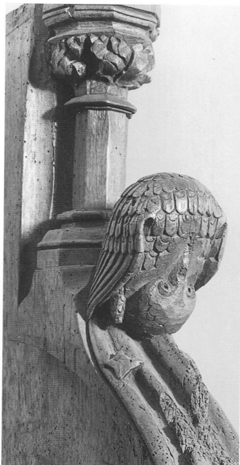
Abb. 16: Geschnitzter Knauf mit einem Käuzchen an einer Seitenwange des Chorgestühls aus dem Basler Münster, um 1350.