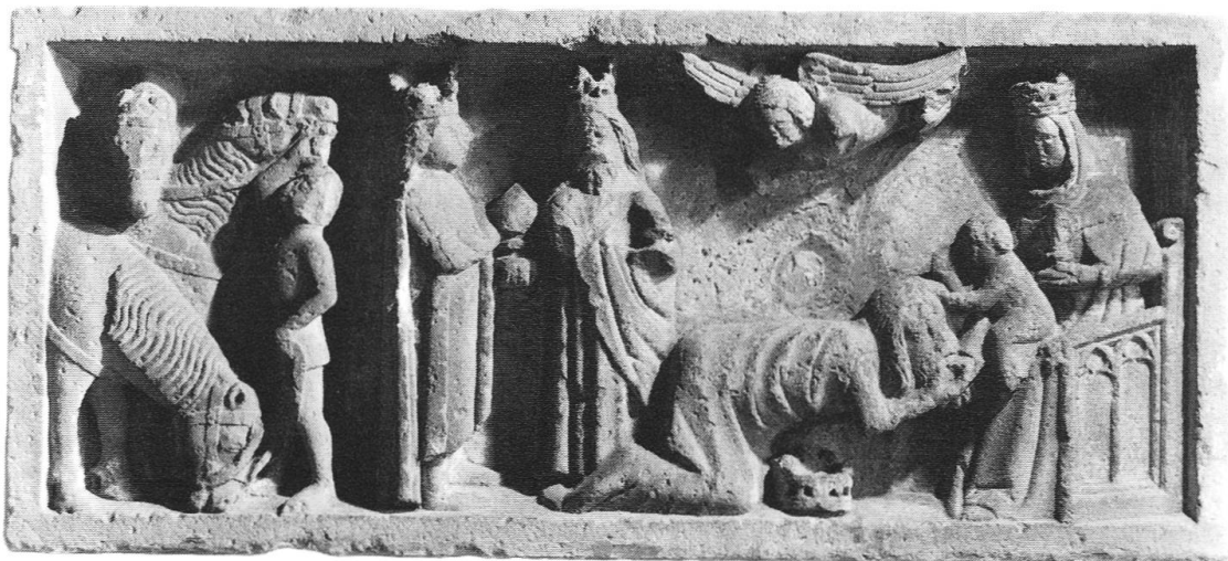
Abb. 12: Dreikönigsrelief, letztes Viertel des 14. Jahrhunderts.