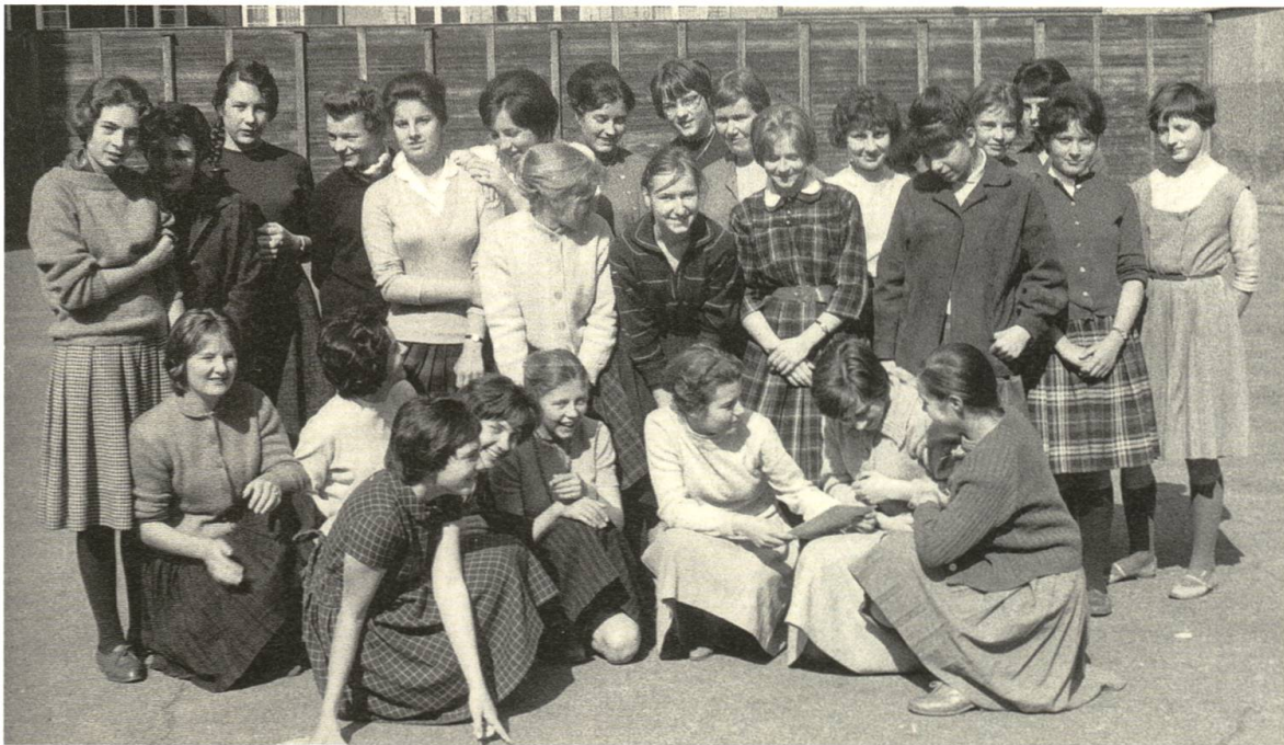
Abb. 21 Die MG-Klasse 4b an Ostern 1961.

ten Lehrermangel zu erklären war. Von den vielen Kolleginnen, von denen einige meine Mutter hätten sein können, wurde ich freundlich aufgenommen, wenn auch manche neidisch waren, und dies zu Recht. Viele hatten länger studiert als ich, hatten promoviert, hätten Professorin an einer Universität sein können. Sie hatten jahrelang, wie viele Männer übrigens auch, darauf warten müssen, am Gymnasium mehr als nur ein paar Stunden erteilen zu dürfen. Für die meisten Lehrerinnen füllte die Schule ihr Berufs- und Privatleben ganz aus. Da es seit den Krisenzeiten von 1930 – damals gab es zu viele Lehrkräfte – in Basel eine Art Zölibatsklausel gab, waren alle festangestellten Lehrerinnen ledig (siehe S. 113 ff.). Als ich selbst 1966 heiratete, musste ich meine feste Stelle kündigen und wurde am folgenden Tag mit demselben Pensum als Vikarin weiterbeschäftigt. Die Pensionskasse durfte ich leider auch nicht weiterführen – ich hatte jetzt ja einen Ehemann und Ernährer –, und noch heute erhalte ich als Pension genau die Summe, die 1966 festgelegt worden war. Dabei wäre ich froh gewesen, die Pensionskasse auf freiwilliger Basis weiterführen zu können. Denn mein Mann, ein ungarischer Arzt, war als politischer Flüchtling mit zwei Koffern in die Schweiz gekommen, und wir konnten uns in unserem ersten Ehejahr nur eine Einzimmerwohnung leisten. Die ledigen Lehrerinnen feierten damals oft Feste unter sich, und ich betätigte mich dabei als eine Art Hoffotografin.