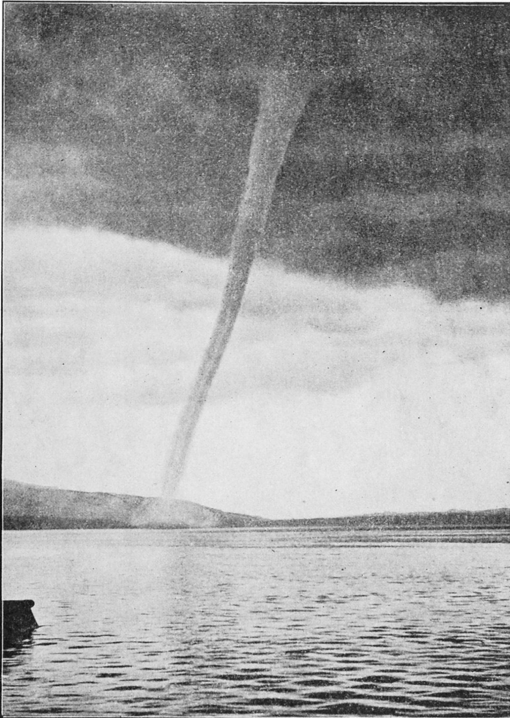
Fig. 1. Nach phot. Aufnahme durch E. Weiss in Zug 4 h 15 m p. in der Richtung zwischen Buonas und Kiemen. Deutliche Röhre vor dem hellen Hintergrunde, plötzlich verjüngt in die Dunsthülle (Fuss) auf der sanft bewegten See- fläche. Ränder der oben posaunenähnlichen Säule wellig.

drückt sich Prof. J. J. Herzog in Zug im „Wächter“ l. c. aus: „Langsam bewegte sich das ganze Prachtgebilde gegen Süden.