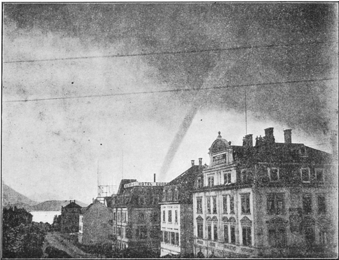
Fig. 3. Nach phot. Aufnahme vom Bahnhof Zug durch die Alpenstrasse über den Kiemen zum Rigi, ca. 4 h 13 m p. Posaunenartige und etwas heller beleuchtete Erweiterung des oberen Teils der Säule (zwischen 2 Telegraphendrähten); im Original deutliche wellenförmige Ränder und vor dem hellen Grunde Röhrenform.

berg 740 Meter am Ruswiler Berg (26 Kilometer) und die fadenförmige Verjüngung des Mittelstückes „wie ein Seil“ wurde auf Rigi-Seeboden genau mittelst eines Zeiss erkannt. Die direkte Teilung bezeugen auch Schmidlin und Roth in Cham. Die bleibende Teilung erfolgte zwischen 4 h 20 m — 4 h 25 m : Wolkentrichter und Stalagmit auf dem See mit aufspritzendem Wasser. Nach andern flog eine Zeit lang ein Stück als flatternd Band oder eine Schlange in der Luft.