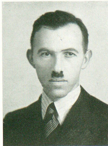
Prof. E. Imhof

Präsident der Geogr.-Ethn. Ges. 1930—1936