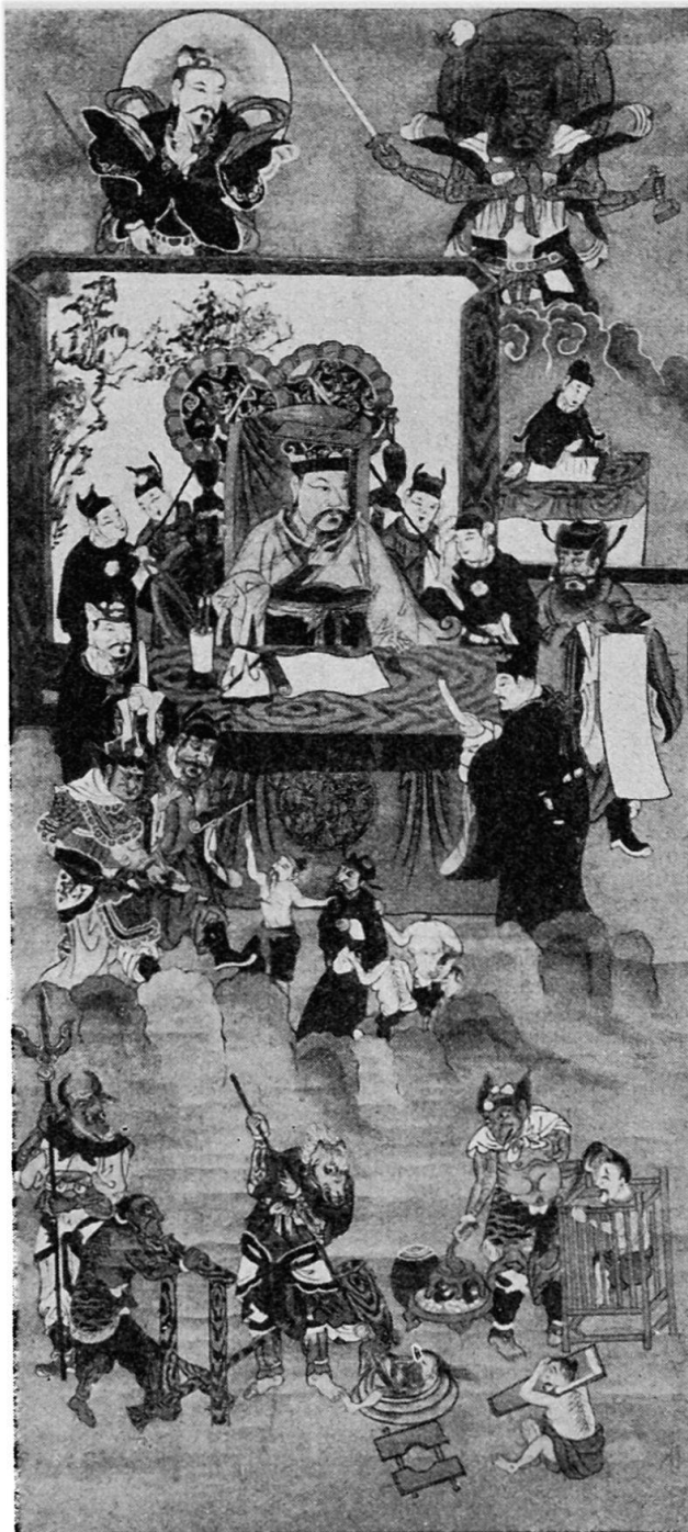
Abb. 1. Chinesisches Rollbild, farbig, 140 × 62 cm, mit Darstellung von Totengericht und Höllenstrafen. In der Mitte der an einem Tisch sitzende Schutzgott der Stadt, der «Vater der Mauern und Wallgräben», umgeben von seinen Trabanten. Rechts der Schutzpatron der Häscher und Polizisten, der auf einer Schreibtafel die Namen der Missetäter einträgt. Darunter die Sekretäre des Stadtgottes mit Buch und Pinsel in den Händen; sie bringen das Verhör, dem die abgesehenen Seelen unterzogen werden, zu Protokoll. Außer den Richtern und dem Zwergteufel, der die Missetäter vor das Höllengericht zu bringen hat, erkennen wir links unten die beiden Pfortner der Hölle, mit einem Dreizack bewaffnet. Beide haben menschliche Gestalt, aber der eine hat einen Pferdekopf (Ma-mien = Pferdgesicht), während der andere (Niu-tou = Rindkopf) einen Ochsenkopf trägt. Die verschiedenen Höllenstrafen sind sehr naturalistisch dargestellt.

Zu diesen Neuerwerbungen sei bemerkt, daß deren Ankauf nur durch den Erlös aus dem Verkauf der letzten Dubletten der afrikanischen Coraysammlung und durch Tausch in diesem Umfang möglich gewesen ist. Im übrigen mußten wir uns, da die Preise für Ethnographica im Vergleich zur Vorkriegszeit stark gestiegen sind und die uns dafür zur Verfügung stehenden Subsidien, die für die heutigen Verhältnisse sehr knapp bemessen sind und für den Ankauf der immer teurer werdenden Objekte nicht mehr ausreichen, darin leider äußerste Zurückhaltung auferlegen. Die Sammlung für Völkerkunde beteiligte sich mit 226 Objekten an der Aus-