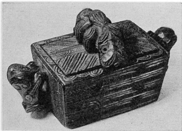
Fig. 2. Reich geschnitzte Holzschachtel der Maori (Neuseeland), mit Perlmuttereinlagen, 31 × 16 cm.

(1 buntes Lederneccessaire für Frauen, aus Marokko) und die Damen S. LEICHER, Zürich (4 zweifarbige Flechtkörbe der Navaho-Indianer), E. McDOUGALL, USA (1 Ikattuch aus Ekuador), Fr. A. BONER, Benares (24 indische Musikinstrumente), und Dr. E. LEUZINGER, Zürich (52 Objekte aus Amerika: Schmuck und Gebrauchsgegenstände der Indianer vom Guaporé in Brasilien, Skulpturen von prähistorischen Töpfen aus Santarem am Amazonas, 3 Objekte von Tiahuanaco und 1 Täschchen von Bolivien, 1 Poncho von Mexiko, 1 Topffragment von Trujillo, 9 Tonfiguren von Mitla, Mexiko, 9 Objekte aus Guatemala und 4 Pfeilspitzen aus Stein von Acoma, USA). Weiterhin erhielt die Sammlung als Geschenk 19 Diapositive (paläolithische Werkzeuge und sonstige Aufnahmen aus Belgisch-Kongo) von Dr. FR. HAUTMANN, Wallisellen, und 3 Photos von Abessiniern von Herrn WEBER, Graphiker in Zürich. Der Zürcher Hochschulverein bewilligte der Sammlung eine Subvention von Fr. 395.20 zur Anschaffung einer Fotokopiereinrichtung, die gute Dienste leistet und hiermit bestens verdankt sei.