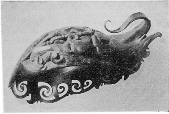
Abb. 1 Reich geschnitztes Ohrgehänge (sog. Anggang gading) der Dayak (Borneo) Material: Horn und Schnabel des Nashornvogels (Buceros). 8,5 x 4 cm