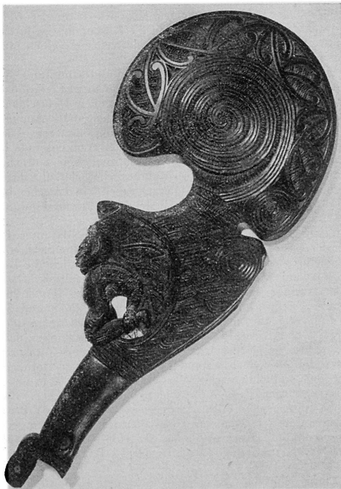
Abb. 4 Reich geschnitzte Holzkeule der Maori (Neuseeland). Höhe 42 cm