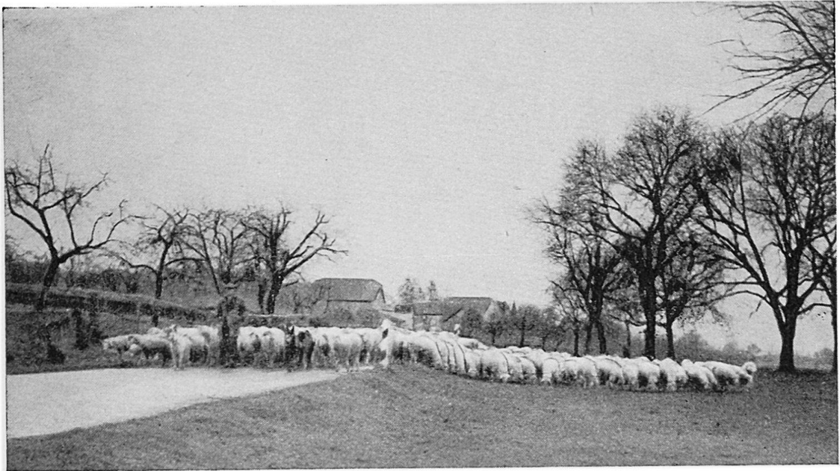
Luzerner Wanderschafherde bei Lausanne

Jeder Herdenbesitzer geht mit seinen Herden immer ungefähr dieselben Wege. Einige Herden kommen regelmäßig im Frühling auf ihre Ausgangspunkte zurück und werden auf gepachteten Alpweiden und auf den Sport- und Flugplätzen des Mittellandes gesömmert (d. h. nur die Zuchttiere und diejenigen Schafe, meistens junge Tiere, welche im Winter nicht abgestoßen wurden). Andere Herden werden im Herbst so zusammengestellt, daß keine Zuchttiere dabei sind, so daß alle Schafe während der Winterwanderung abgestoßen werden können. Die Herden wandern auf verschiedenen, getrennten Routen durchs Mittelland, einige werden eine Strecke weit mit der Bahn transportiert, andere wandern ein paar hundert Kilometer, andere dagegen relativ wenig weit. Auf Grund meiner Erhebungen bei allen Herdenbesitzern lassen sich etwa folgende Ausgangspunkte und Wanderrouten festhalten: