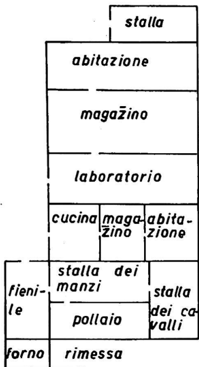
Pianta della masseria Pollicarini sul Lago di Pergusa (Provincia di Enna)

come nei casi della Conca d'Oro di Palermo e delle montagne circostanti, della regione vinicola di Trapani e Marsala e la zona del frumento della Sicilia Centrale. Quest'ultima soltanto ci dimostra due tipi d'insediamento umano in funzione della posizione: quello di cresta e quello di castello. Citiamo come esempio del primo tipo la città di Caltanissetta e il villaggio di Serradifalco. Centro della produzione dello zolfo della Sicilia e nel contempo centro amministrativo dell'industria mineraria siciliana è la città di Caltanissetta posta su di una serie di argille sabbiose. Serradifalco è invece costruita su di un complesso di calcari.