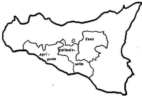
Confini e territori delle tre province di Caltanissetta, Enna e Agrigento

logica del miocene e del pliocene. Soltanto un orlo costiero, allargato di poco nella regione di Gela, è costituito di depositi terziari e dimostra minimi dislivelli altimetrici, in ontrasto con la maggior parte della regione collinare che si trova ad un'altitudine che oscilla tra i 200 ed i 1000 metri.