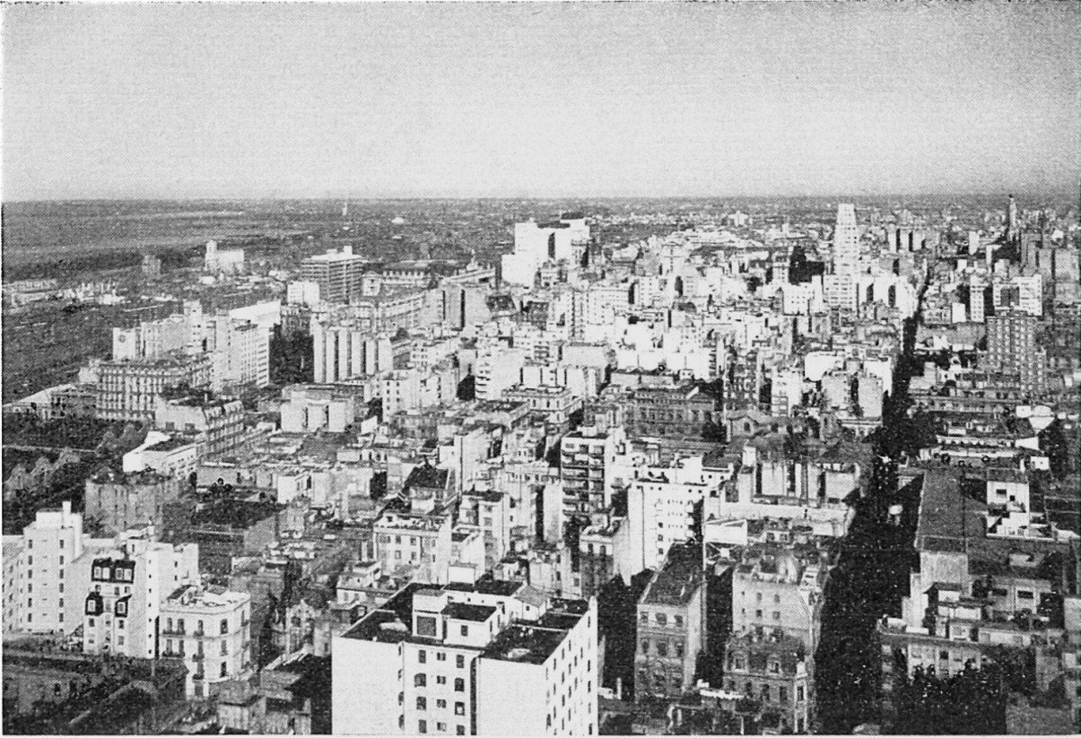
Blick über Buenos Aires.

Garay im Gebiet der heutigen Plaza de Mayo angelegt . Allmählich entstand um den befestigten Platz eine Siedlung, die sich hauptsächlich als Verwaltungs- und Umschlagsmittelpunkt entwickelte. Entsprechend der 1513 bzw. 1521 ergangenen königlichen Anweisungen wurden die spanischen Kolonialstädte in Amerika, also auch Buenos Aires, nach dem Schachbrettmuster angelegt, das letztlich auf die römischen Stadtpläne zurückgeht, die durch ein rechtwinkliges Koordinatensystem charakterisiert waren. Zwar hat sich Buenos Aires im einzelnen anders entwickelt, als im Plan von Juan de Garay vorgesehen war, aber das Grundschema wurde im wesentlichen eingehalten, ohne daß dabei das Schachbrettmuster so streng als Vorbild gedient hätte wie in verschiedenen anderen Städten, etwa in Rosario. So ist z. B. im Gebiet der Straßen Santa Fé und Pueyrredon der Schachbrettmustergrundriß zugunsten einer weniger regelmäßigen Straßenführung aufgegeben worden.