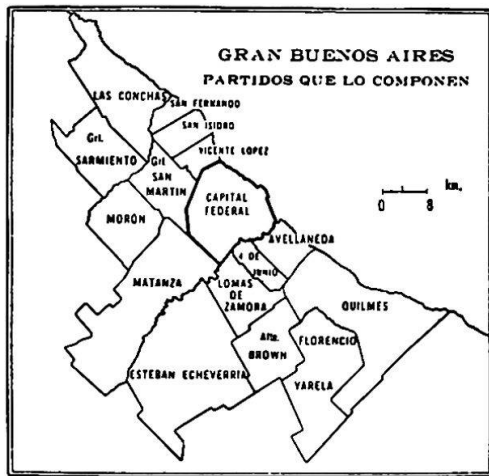
Die Bundeshauptstadt (Capital Federal) und die zur Provinz Buenos Aires gehörenden Stadtgemeinden von Gran Buenos Aires (nach Guía Peuser)