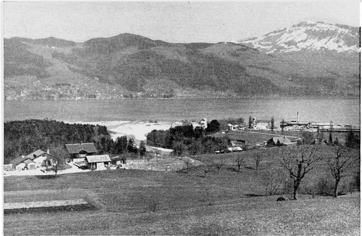
Blick vom Strättlinger Hügel auf den östlichen Teil des Kandergriens. Der ältere Teil des Deltas ist bewaldet. Gegenüber Oberhofen; rechts der schneebedeckte Sigriswiler Grat. 6. April 1952

2. Die Mittelzone begrenze ich durch die Isobathen von 390 m und 470 m ü. M. Sie besteht aus den beiden glazial geschliffenen, stark durchtalten, ehemaligen Talflanken, die sich durch große Steilheit zu erkennen geben. Die östliche Abgrenzung gegen das Bödéli zeigt eine steile, stark durchtalte Felsschwelle, deren östliche Abdachung vom Bodelidelta völlig verdeckt ist. Diese Feststellung dürfte neu sein, denn in der Literatur wird nirgends auf die Existenz eines solchen Talriegels hingewiesen. Das Vorhandensein eines solchen Felsriegels erklärt jedoch gut das rasche Wachstum des Bödéli.